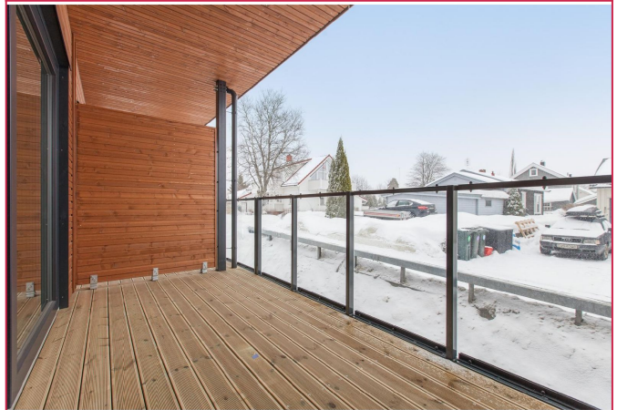
Fra stuen er det utgang til solrik sydvendt balkong.