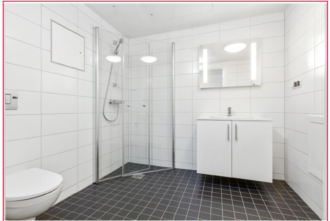
Lekker flislagt bad med innfellbare dusjvegger, vegghengt klosett, servant med underskap og oppl.VM