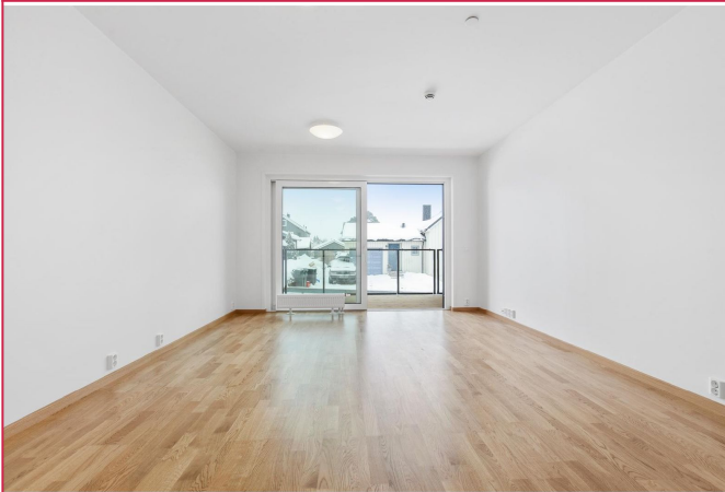
Leiligheten har en åpen kjøkken/stue løsning, som gir plass til både sofagruppe og spisebord.