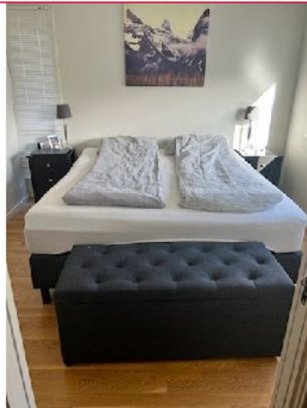
Hovedsoverom med egen "walk in closet"