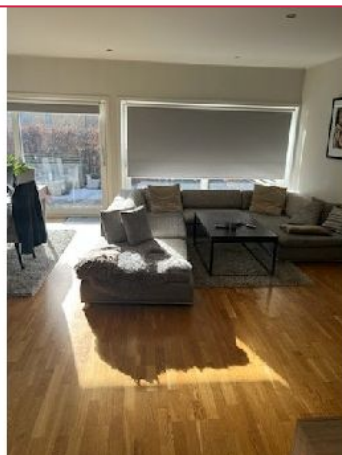
Stor og lys stue