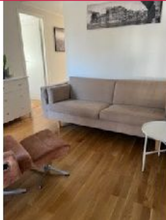
Gang 2 etasje