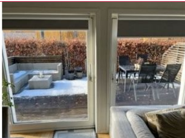
Stor veranda og balkong