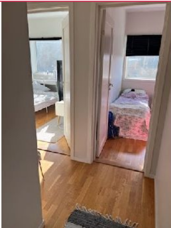
Boligen inneholder 3 soverom