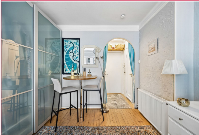
Integrert garderobeskap og barløsning i oppholdsrommet