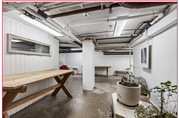
Praktisk kjeller for alle beboere