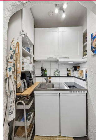
Delvis oppgradert kjøkken med ny koketopp!