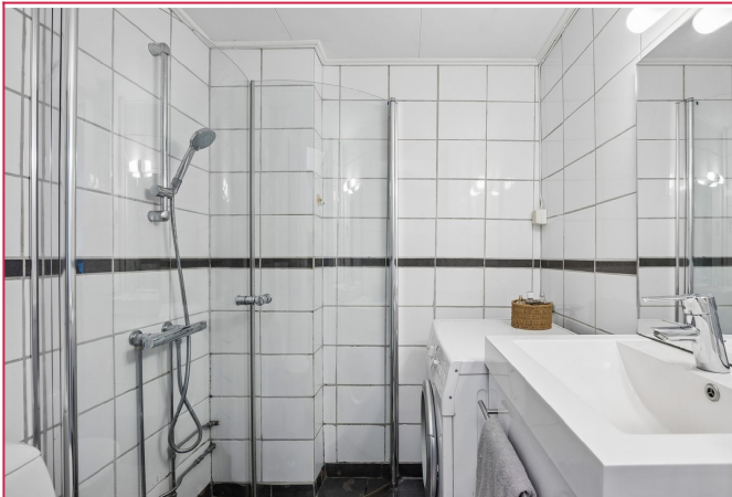
Bad m/ vaskemaskin og dusjhørne