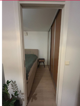
Inn til hovedsoverommet!