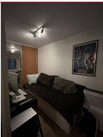
Soverom 2 har også en romslig skyvedørsgarderobe.