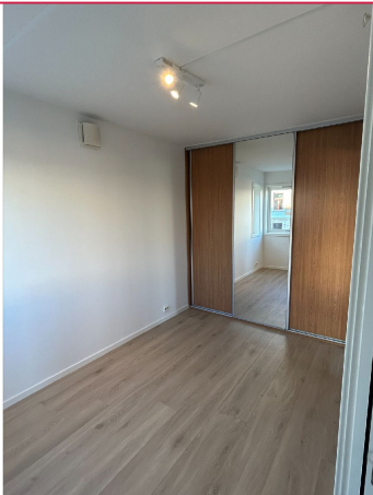
Hovedsoverom med romslig skyvedørsgarderobe