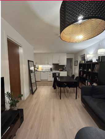
Leiligheten er pusset opp i 2025!