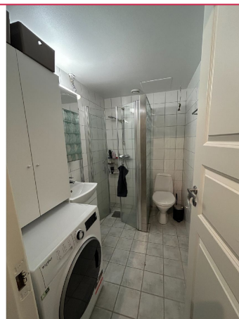
Bad - vaskemaskin følger ikke med.