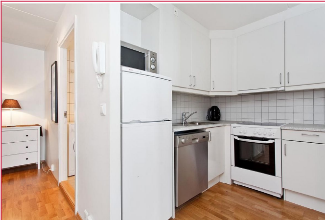
Moderne og praktisk kjøkken med nødvendige hvitevarer, inkludert kombiskap og komfyr.