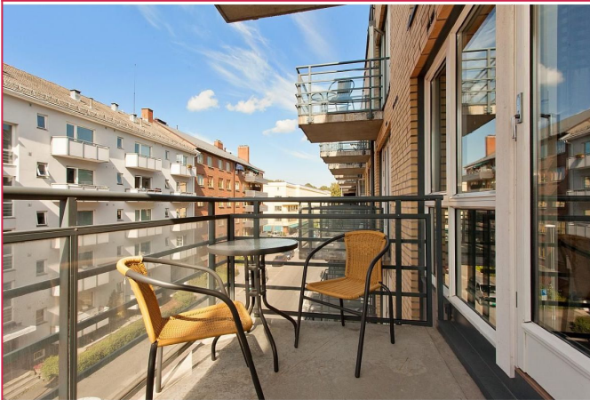
Lys og trivelig balkong med plass til et lite bord og to stoler.