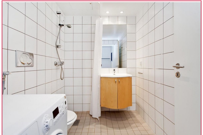
Flislagt bad med dusj og plass/ opplegg til vaskemaskin.