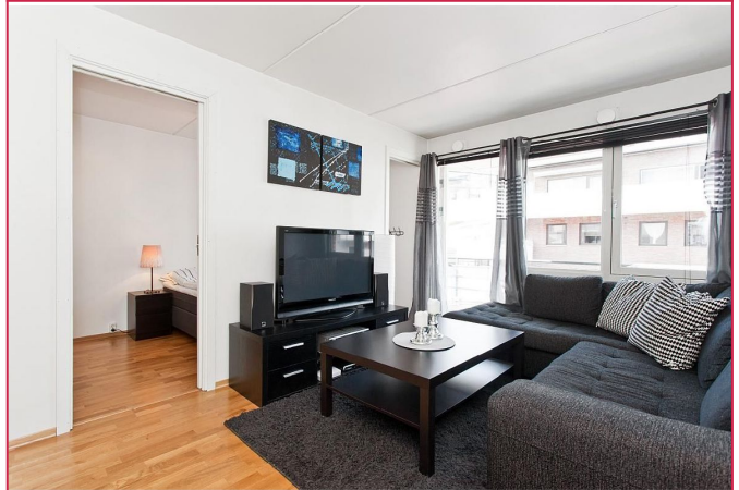
Stue med store vindusflater som slipper inn rikelig med dagslys.