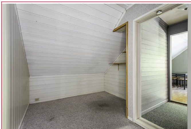
Disponibelt rom som kan benyttes som kontor eller garderobe etter ønske.