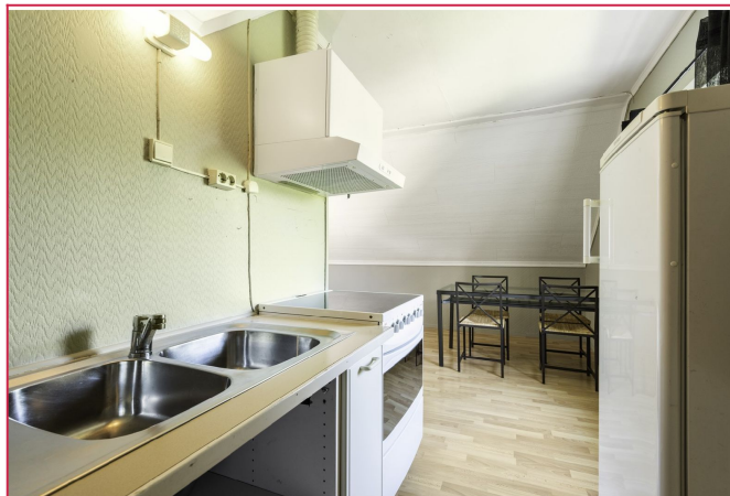
Funksjonelt kjøkken av eldre standard.