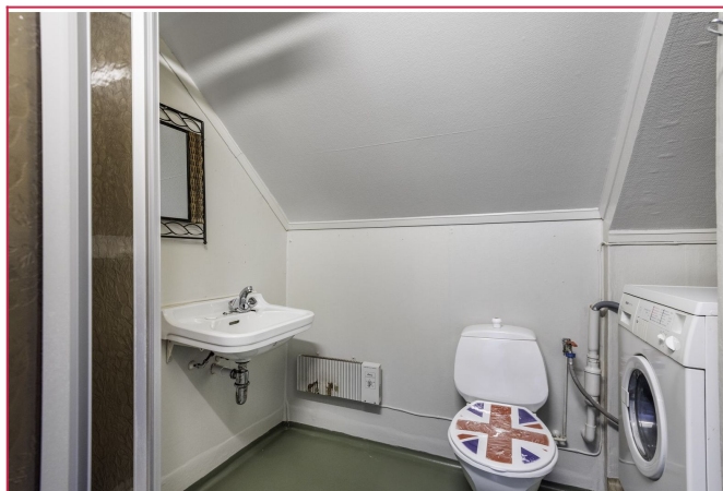
Badet har dusjkabinett og opplegg for vaskemaskin.