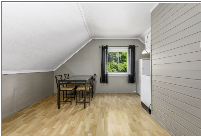
Leilighetens stue og spise plass.