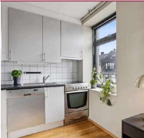
Kjøkken - leiligheten er ledig omgående -