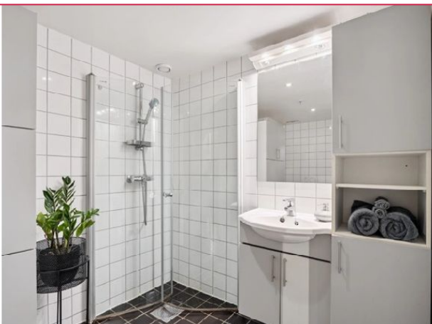
Baderom - Med varmekabler -