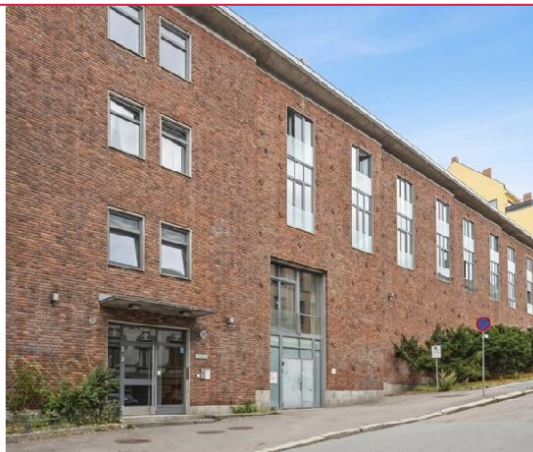
Fasade - Velkommen på visning -