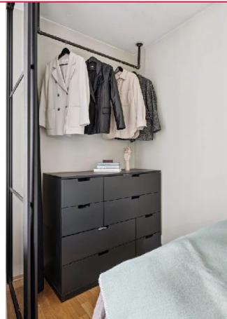
Garderobedel av sovealkove