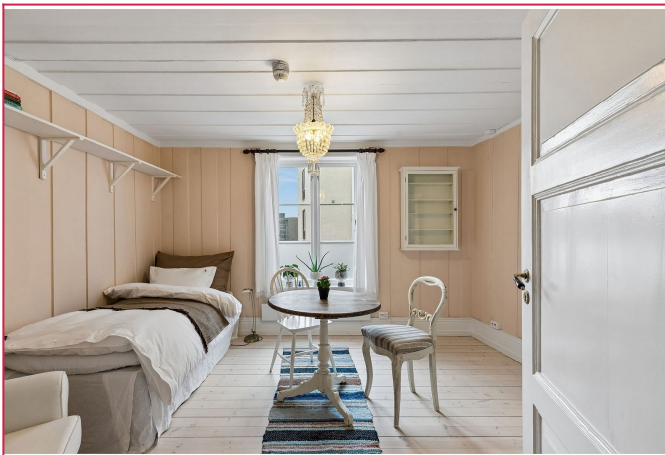
Møbler kan medfølge om ønskelig.