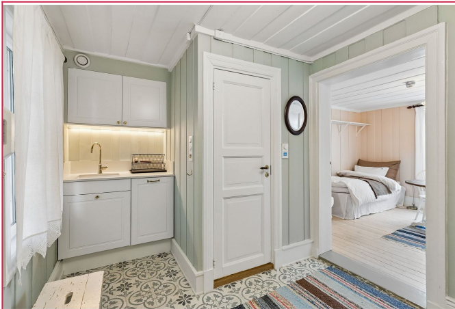
Varmekabler i gulv.