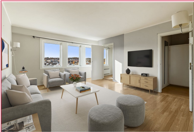
Romslig stue med store vindusflater som slipper inn godt med sollys. Digitalt stylet.