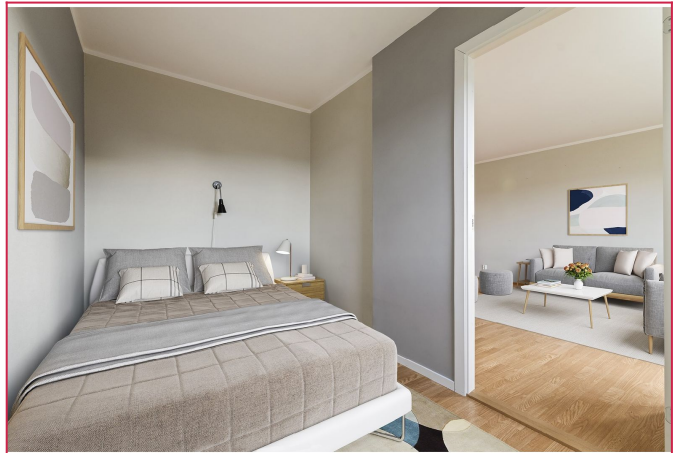
Soverom med god plass til dobbeltseng. Digitalt stylet.