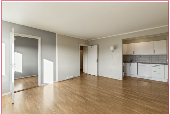
Åpen stue og kjøkkenløsning.