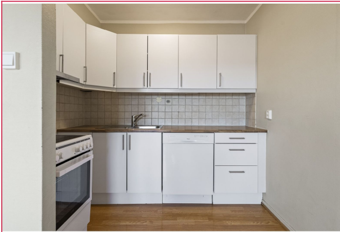
Kjøkkenet i hvite fronter med komfyr og oppvaskmaskin.