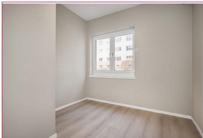
Nyetablert soverom, vender ut mot rolig området.