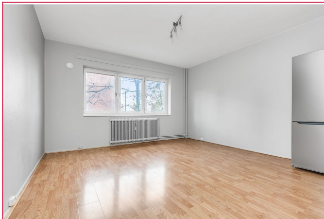
Åpen kjøkkenløsning mot stue. God plass til møblering.