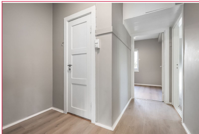
Praktisk entré med god plass til oppbevaring. Tilknyttet callinganlegg.