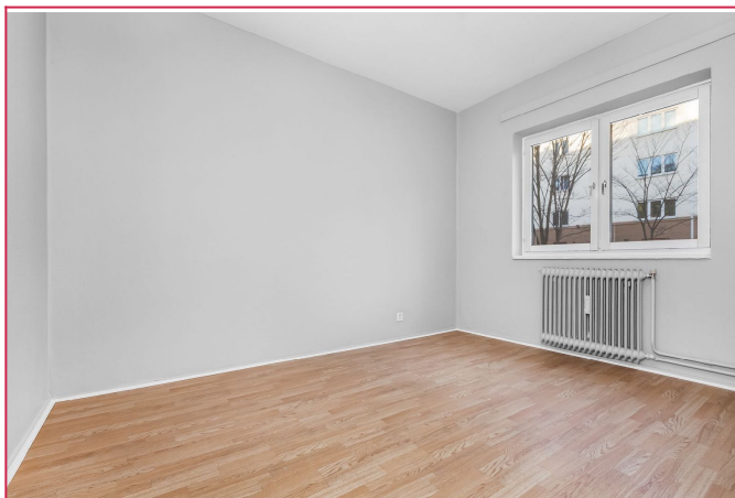
Romslig og lyst soverom med god plass til garderobeskap.