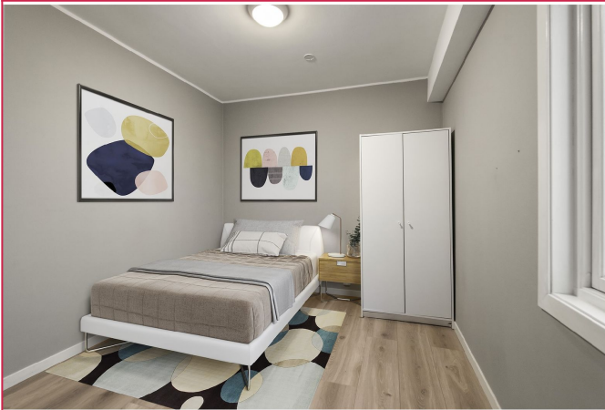
Hovedsoverom digitalt stilet.