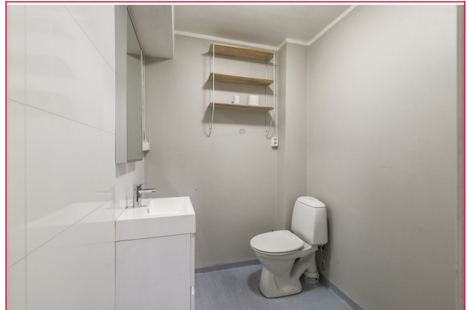
Bad med dusjhjørne, toalett og servant m/innredning.