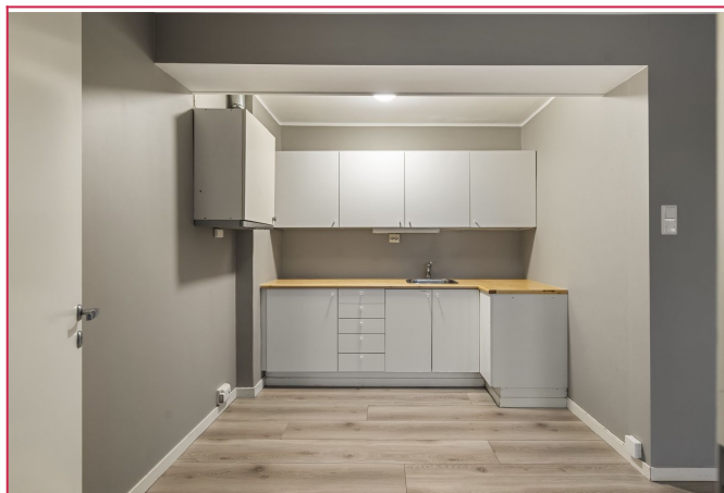
Kjøkken i hvite fronter med god skap og benkeplass.