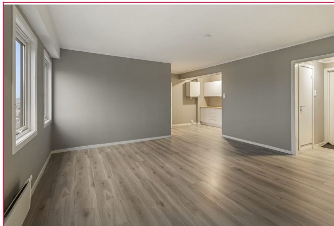
Åpen stue og kjøkkenløsning.