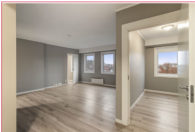
Stue og soverom.