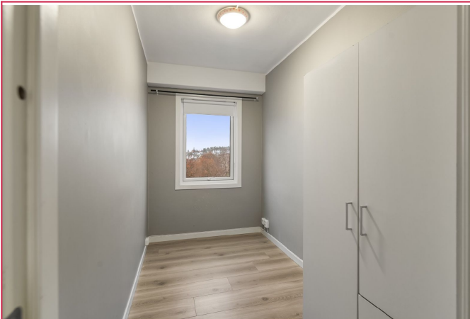
Soverom 2 med garderobeskap.