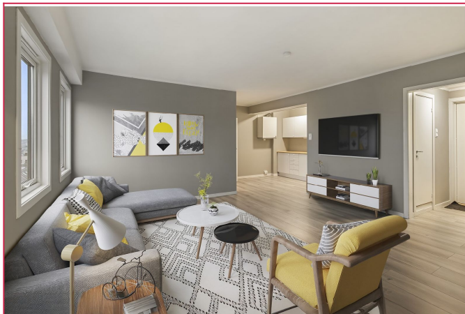
Åpen stue- og kjøkkenløsning. Digital styling.