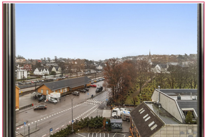
Utsikten fra leiligheten. Velkommen til visning!