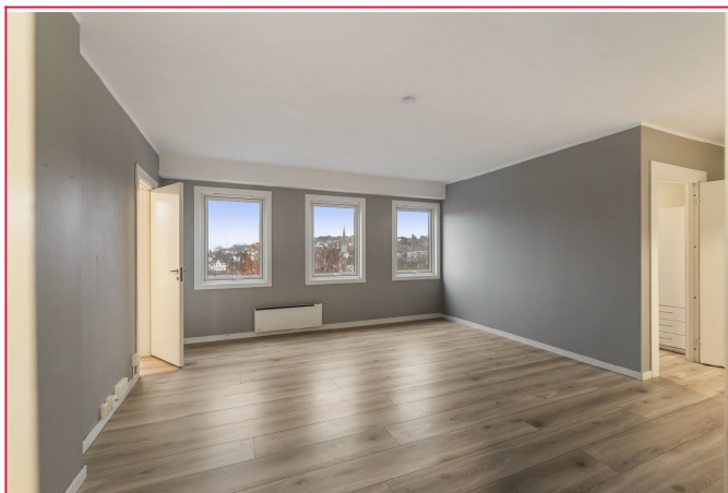
Romslig stue med store vindusflater som slipper inn godt med sollys.