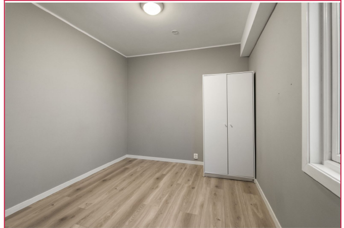
Hovedsoverom med garderobeskap.