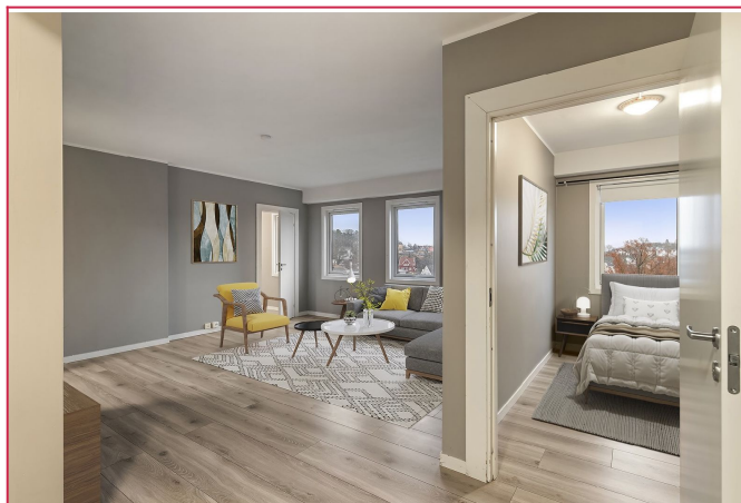
Stue og soveorm digitalt stilet.