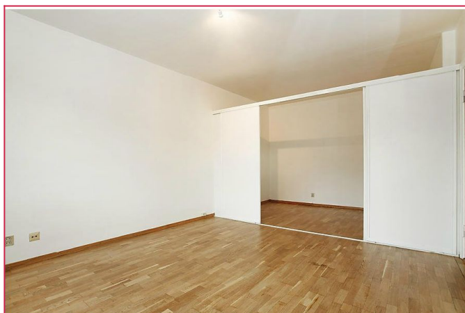
stue til sovealkove