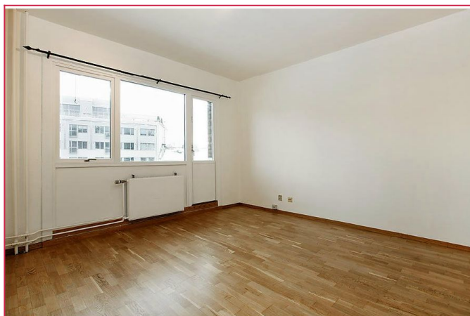
Stue med utgang balkong