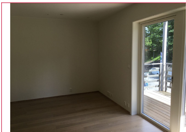
Stue med utgang balkong uten gjenboere