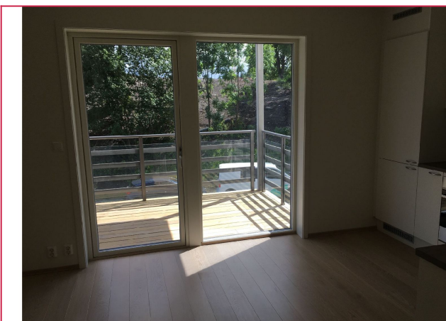
På balkongen er det sol fra morgen til ettermiddag