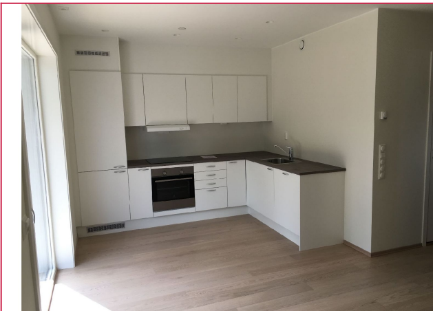
Kjøkken med integrerte hvitevarer