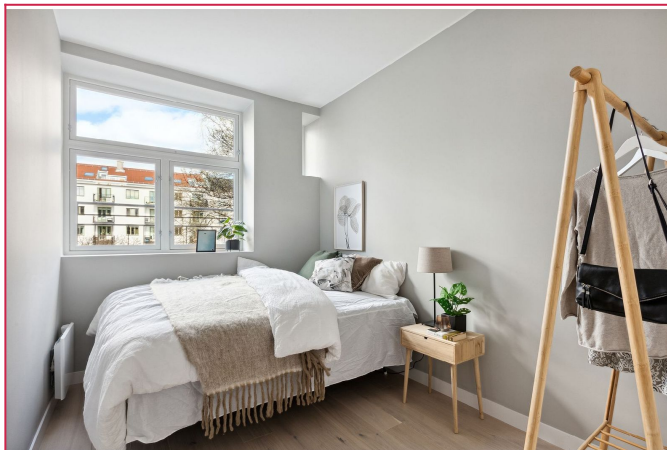
Hovedsoverom er av god størrelse og vender inn mot bakgård

SAKSNUMMER 54225 - MOGATA 22 B, 0464 OSLO