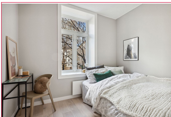
Soverom 2 har plass til 160 seng. Vender inn mot bakgård.