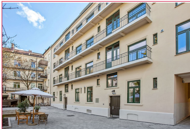
Bakgård med sittegruppe, sykkelparkering og felles brannbalkonger