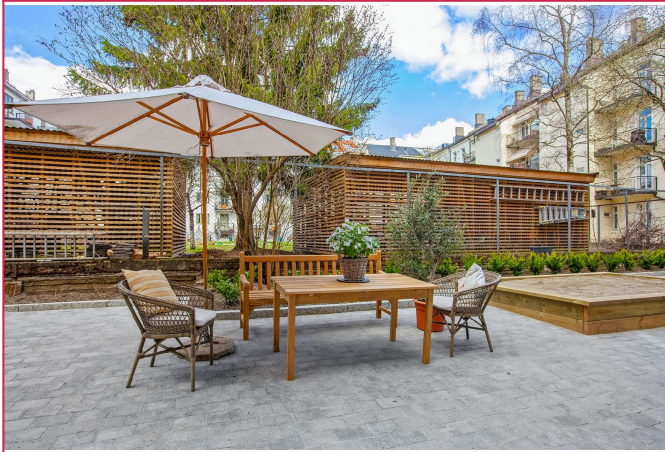
Koselig bakgård med felles sittegruppe