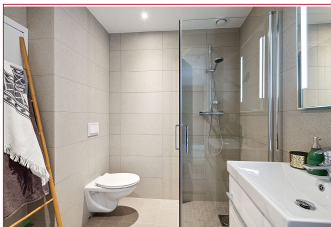
Pent flislagt badrom med opplegg til vaskemaskin