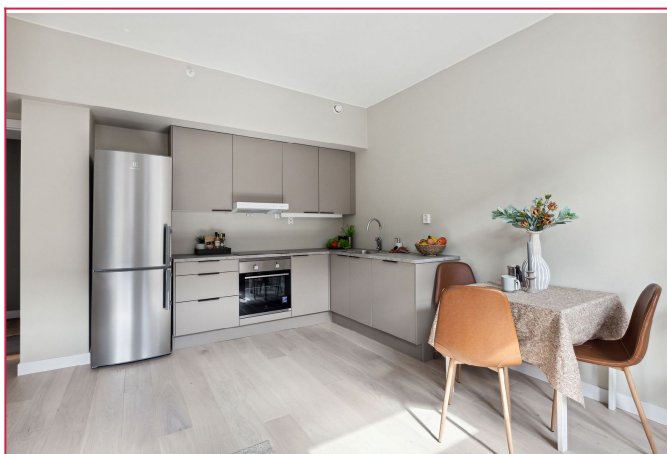
Åpen stue-kjøkken løsning- nyrenovert i 2023.