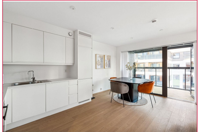
Åpen planløsning med store vindusflater gir leiligheten en romslig atmosfære.