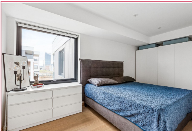
Soverom av god størrelse med store garderobeskap.