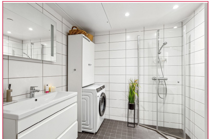
Flislagt bad med innfellbare dusjdører