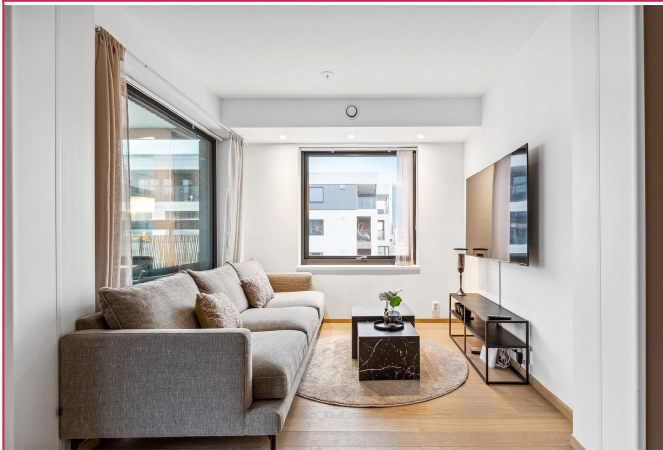
Oppvarming fra vannbåren varme, varmtvann, TV, internett og V&A-utgifter ink. i leien.