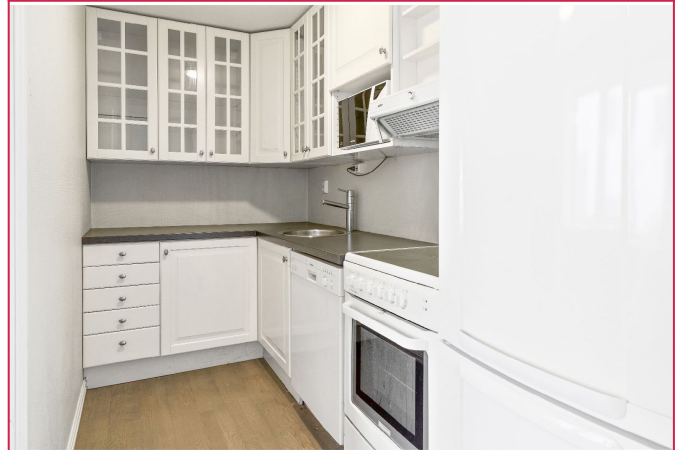
Kjøkkenet er utstyrt komfyr, oppvaskmaskin og kombiskap.