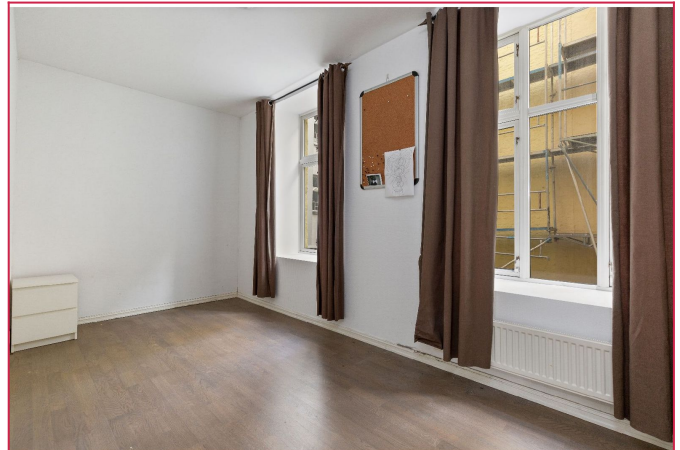
Soverom en med garderobeskap.