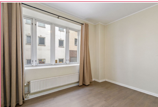
Soverom to med garderobe.