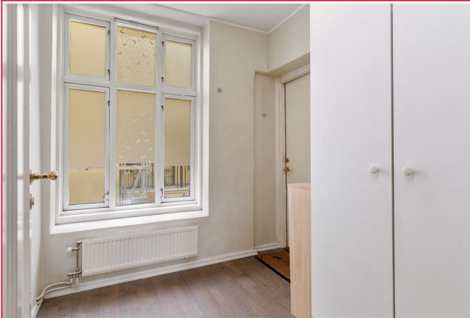
Entré med garderobeskap.