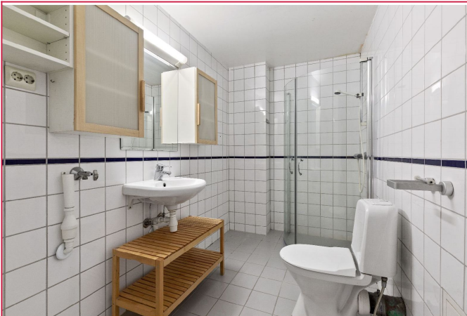
Badet har opplegg for vaskemaskin. Varmtvann inkludert.