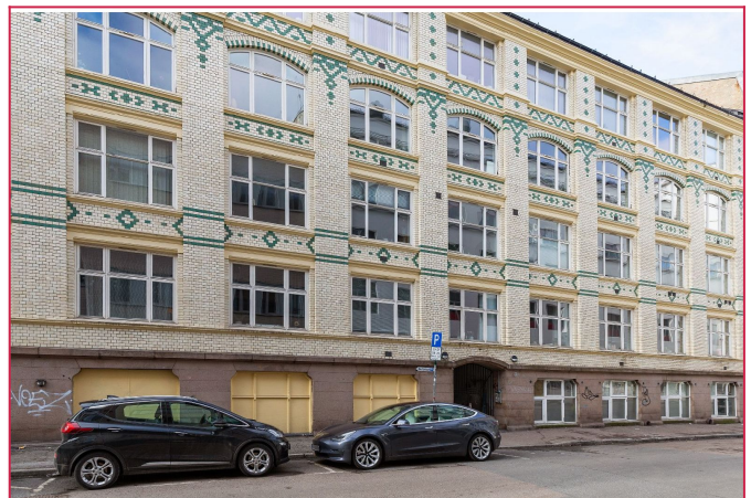
Fasade - Leiligheten ligger i andre etasje fra lukket bakgård