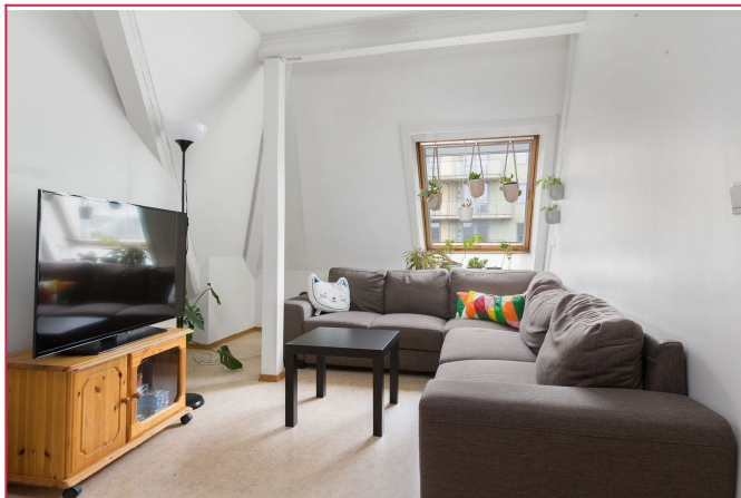
Det ene soverommet kan brukes som stue med plass til sofagruppe og tv