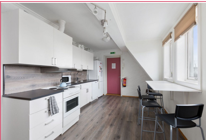
Kjøkkenet har godt med skaplass og har både spisegruppe m barstoler og spisebord i kjøkkenarealet.