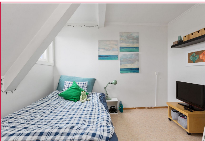
Bygget har egen vaktmester som kan kontaktes gjennom Utleiemegleren