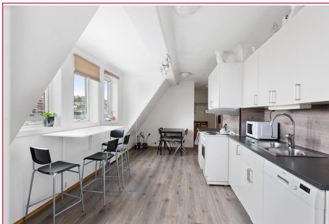
Lys og fin 5-roms leilighet med kjøkken og bad. Hvittevarer følger med.