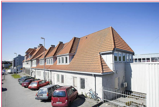
Fasade: Leiligheten ligger i 3.etg i Jarleveien 8 på Lademoen.