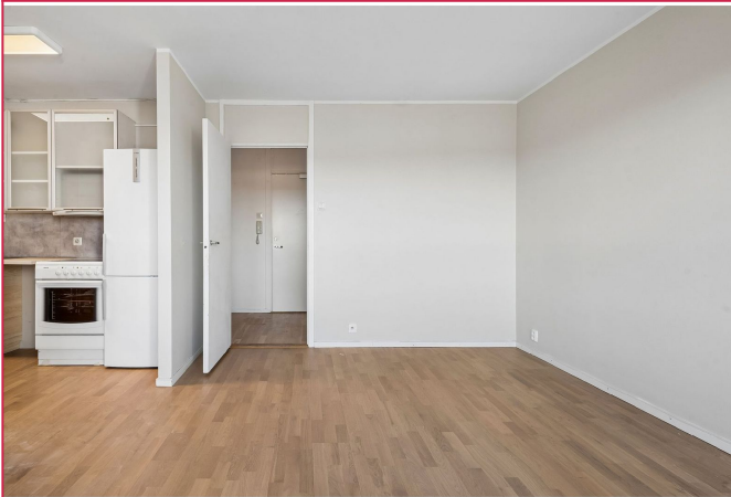
Åpen løsning mellom stue og kjøkken