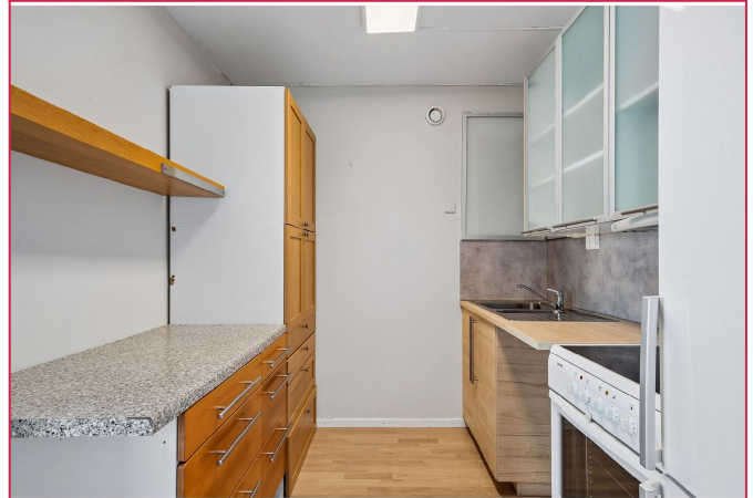
Kjøkken med hvitevarer