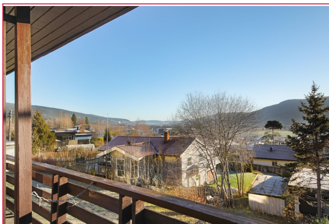
Utsikt fra balkong.