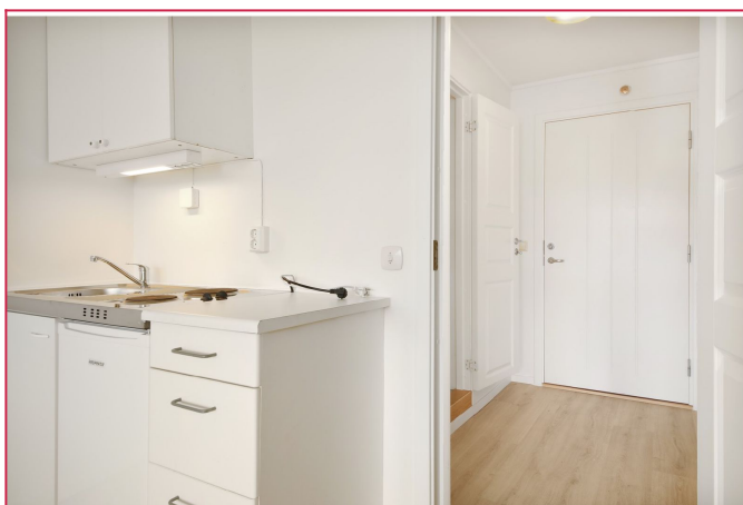
Kjøkkenet er utstyrt med kokeplater samt kjøskap.