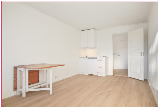
Stue og kjøkken i åpen løsning.