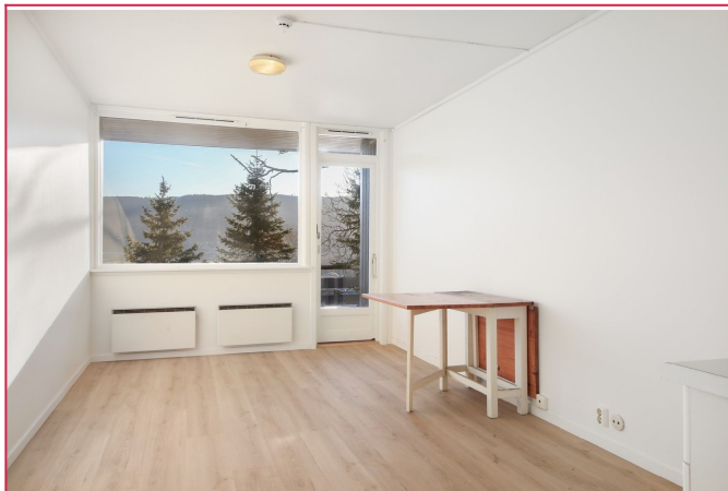
Stue med flere møbleringsmuligheter.