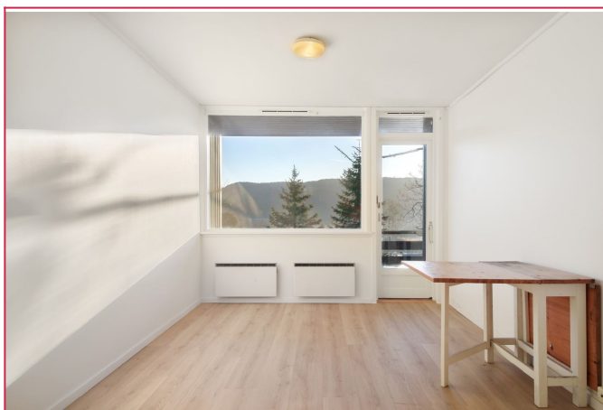
Det er utgang til balkong fra stuen.