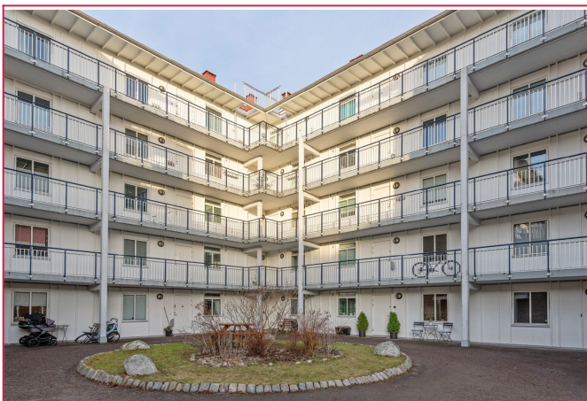
Pent opparbeidet gårdsrom.