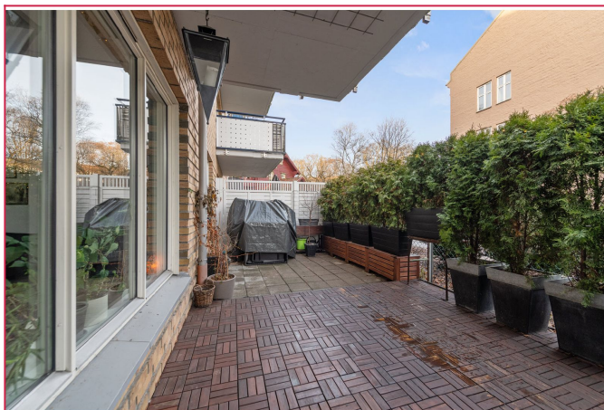
Skjermet markterasse med god plass til utemøblement.