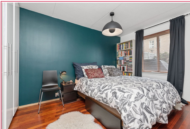
Romslig soverom med god plass til dobbeltseng. Garderobeskap medfølger.