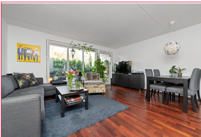
Stue med god plass til både sofa- og spisegruppe. Utgang til stor og skjermet markterasse.