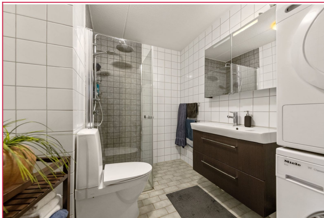
Pent flislagt bad med varmekabler. Hvitevarer medfølger.