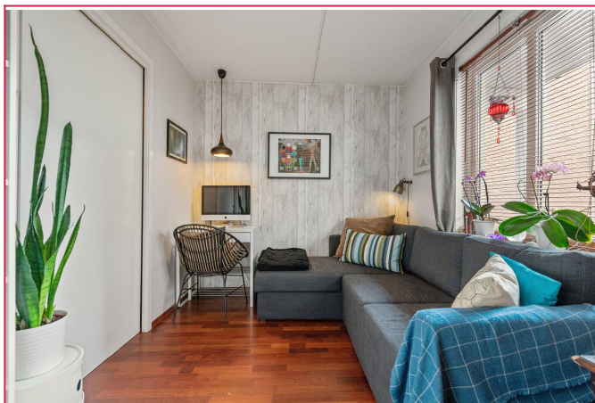
Soverom 2 med inngang til innvendig bod/garderobe.