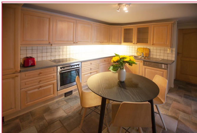
Stort kjøkken med lange overflater og god skaplass.