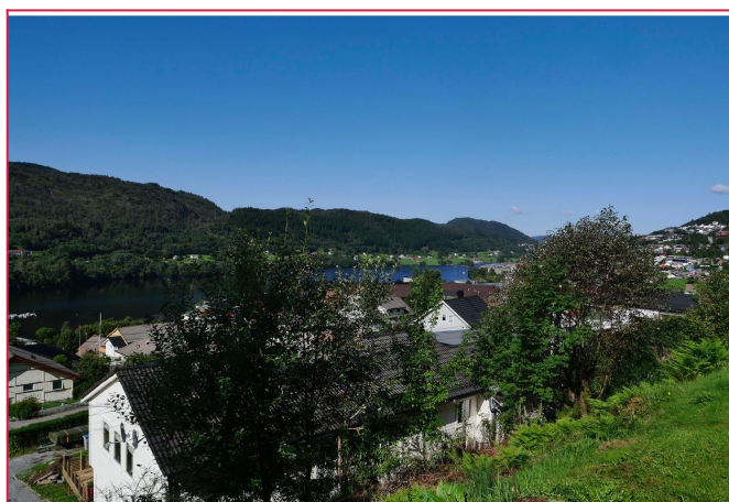
Utsikt til Arnavågen fra uteområdet - Kontakt megler for visning!