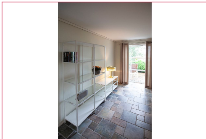
Utgang til uteområdet fra stuen.