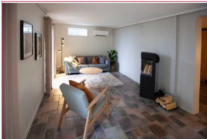
Lys stue med store vinduer - Inneholder varmepumpe og vedovn.