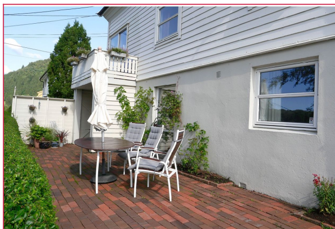
Like utenfor boligen finner man et eget uteområde hvor man kan nyte varme sommerdager.