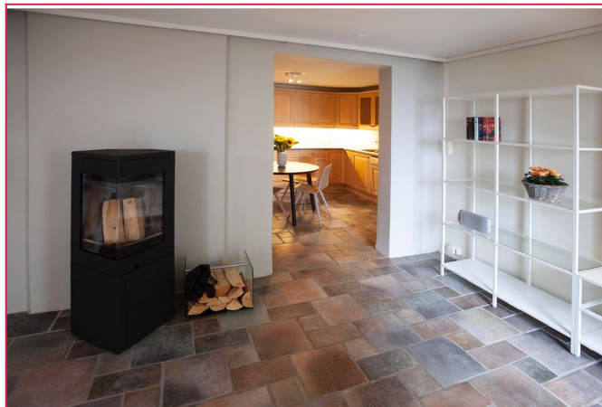
Stuen har direkte adkomst til kjøkken.