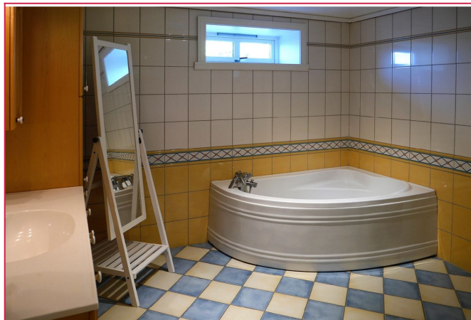
Helfiset badrom - Inneholder servant, wc, dusj og badekar.