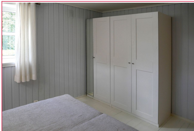
Soverommet kommer møblert og har god skaplass.