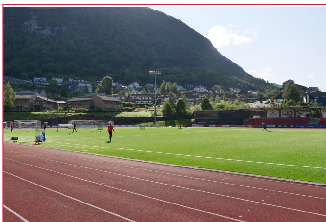
Nabolaget ligger flott plassert like ved Arna idrettspark.