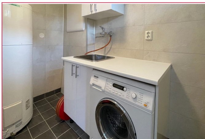
Helfiset vaskerom med adkomst til entrè - Inneholder servant og vaskemaskin.