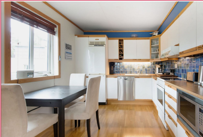
Romslig og lyst kjøkken med plass til egen sittegruppe. Malt i fargen Sans fra Jotun i 2022.