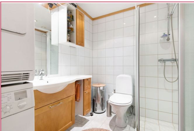
Bad med plass til vaskemaskin og tørketrommel. Dusjarmatur eg også byttet siden bildet.