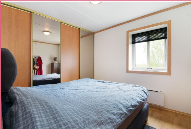
Soverom - Malt i 2022 i fargen Sand.