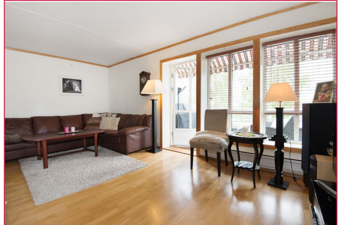
Stue med utgang balkong - Malt i fargen Sans fra Jotun i 2022.