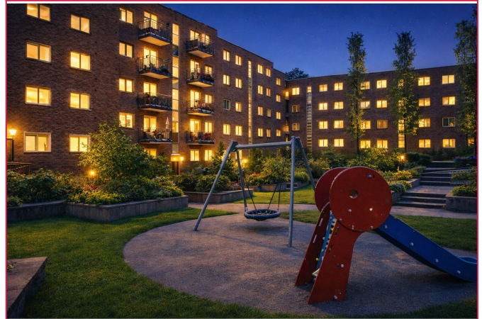
Grønt og frodig gårdsrom med lekeplass samt sitte- og grillområde for voksne.