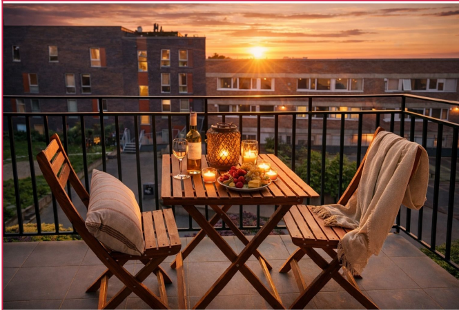
Leiligheten har en solrik balkong mot et fredelig gårdsrom, som gir en lun og privat atmosfære.