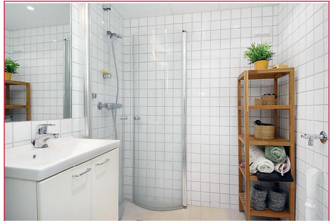
Flislagt bad med varmekabler og opplegg for vaskemaskin.