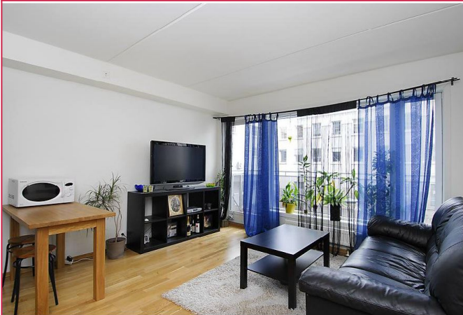
Stuen har plass til sofagruppe og spisebord. Leies ut umøblert. Fra stuen er det utgang til balkong.