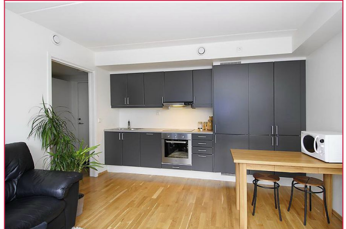
Åpent kjøkken med alle hvitevarer inkludert. Rikelig med benke- og skaplass.