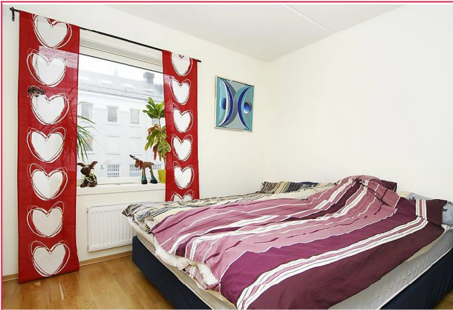
Romslig soverom med et garderobeskap og plass til en dobbeltseng.