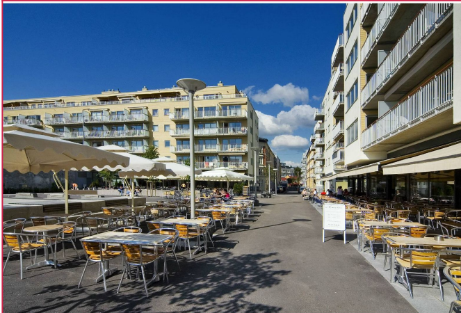
Teaterplassen ligger i umiddelbar nærhet.