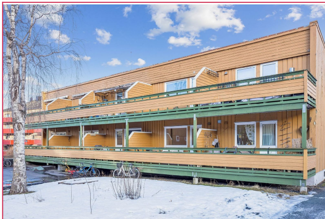
Leiligheten ligger fint til i høy 1. etasje med balkong ut mot fellesareal/bakgård

SAKSNUMMER 65933 - HANSKEMAKERBAKKEN 1 B, 7018 TRONDHEIM