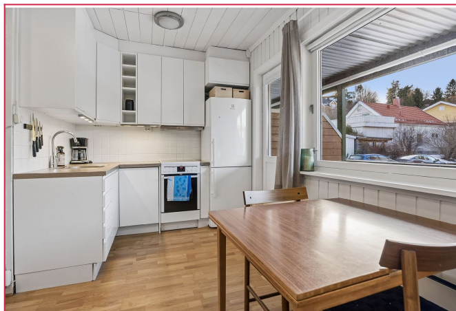
Kjøkkenet holder en pen standard, og er innredet med oppvaskmaskin, komfyr og kombiskap.