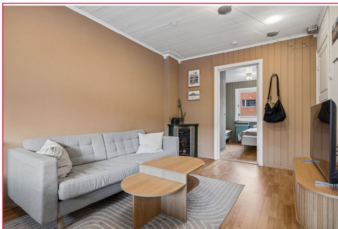
Stuen er malt i moderne farger og har delvis åpen løsning mot kjøkken