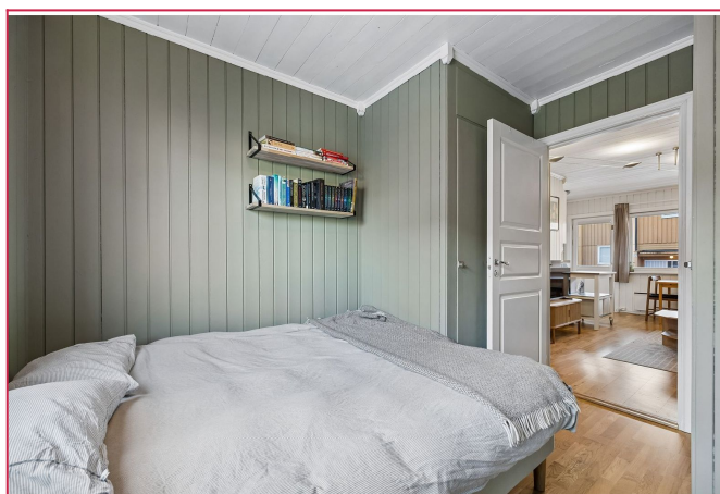
Romslig soverom med mye garderobe, og plass til dobbeltseng samt skrivepult.