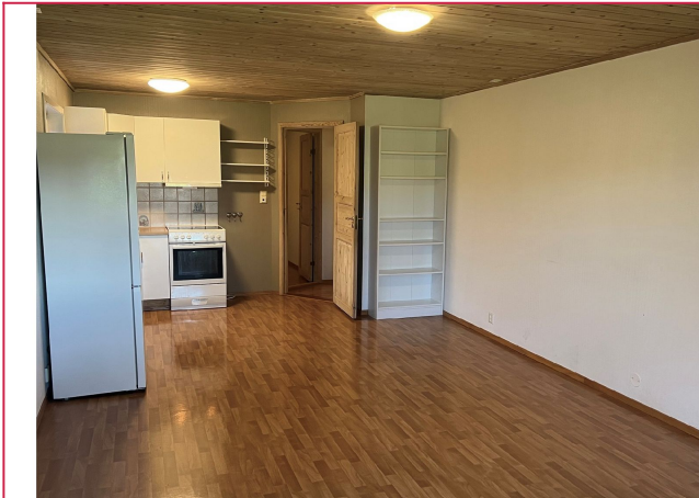
Kjøkken og stue i ett