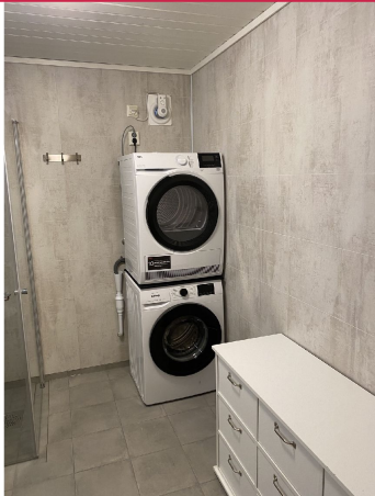
Nylig oppusset baderom