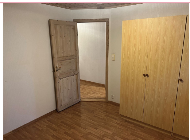
Soverom har godt med skaplass