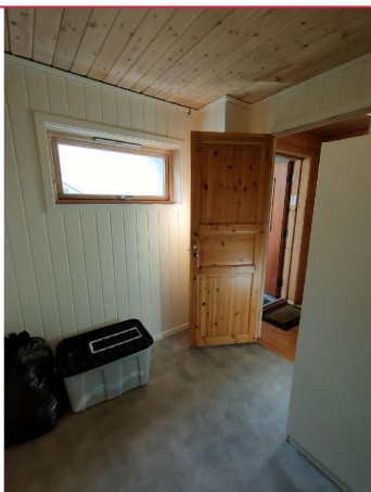
Felles bod i kjeller