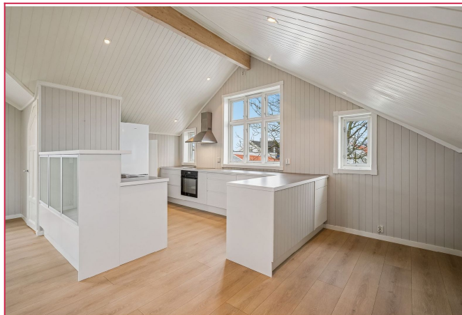
Stort og flott kjøkkenløsning