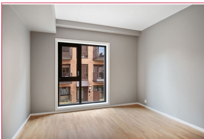
Hovedsoverom med god plass til dobbeltseng, nattbord og annet tilhørende møblement.