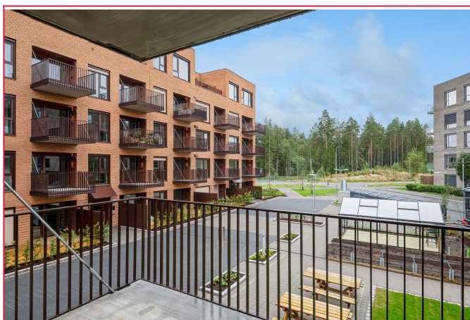
Leiligheten har en balkong med gode solforhold.