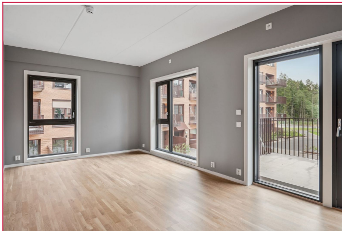
Lys og åpen stue med plass til sofagruppe og tilhørende møblement.