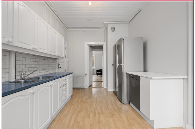
Kjøkken med mye skap- og benkeplass.