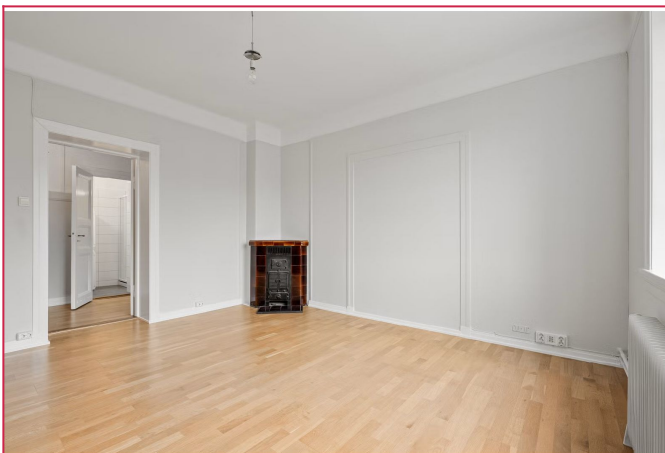
Soverom 1 - alternativt stue med kamin.