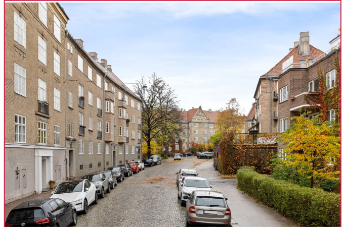
Hyggelig brostensbelagt gate med flere større trær som omkranser bygningene.