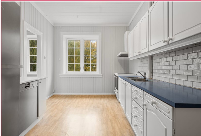
Kjøkken i heltre med frysenskap, kjøleskap, oppvaskmaskin, komfyr og sentralt avtrekk.