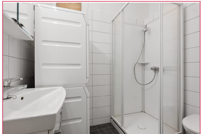
Bad med vaskemaskin, tørketrommel, dusjkabinett, servant og toalett. Det er varmekabel i gulvet.