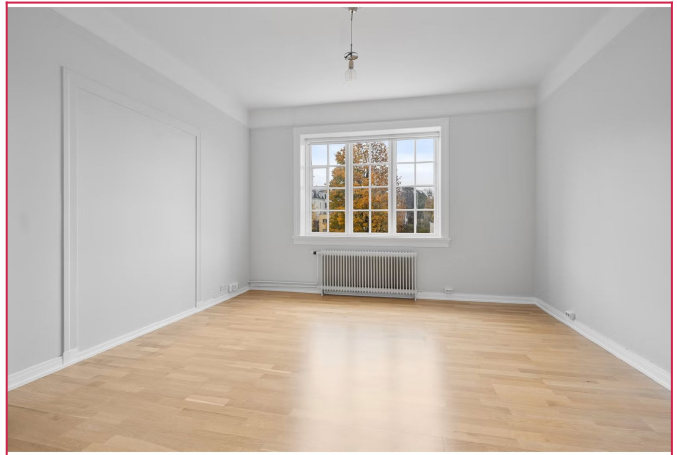
Soverom 1 - alternativt stue.