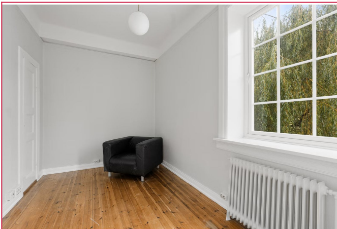
Det minste soverommet - soverom 4.