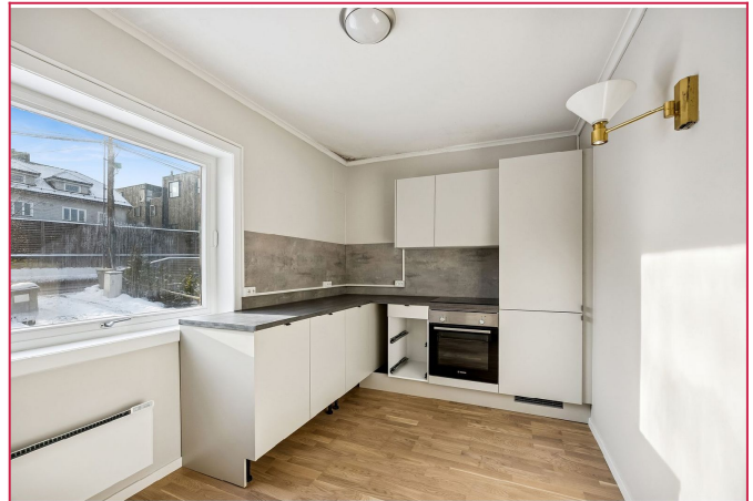
Nytt kjøkken med hvitevarer (dør kommer)