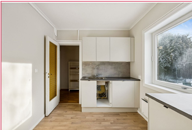
Nytt kjøkken (Dør kommer)