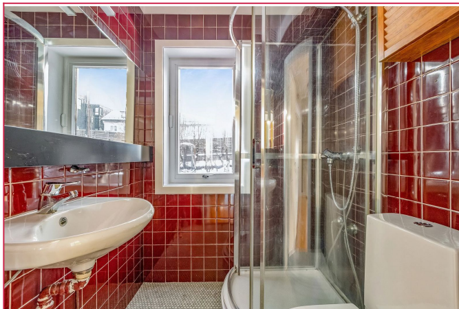
Bad med dusjhjørne