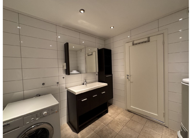
Delikat, flislagt baderom med toalett, servant m/innredning, dusj og vaskemaskin.