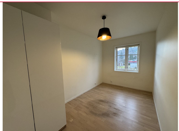
Soverom 2 er lyst og trivelig.