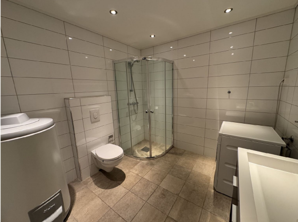
Delikat, flislagt baderom med toalett, servant m/innredning, dusj og vaskemaskin.