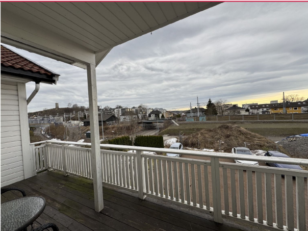
Balkong med ettermiddags- og kveldssol. Velkommen til visning!