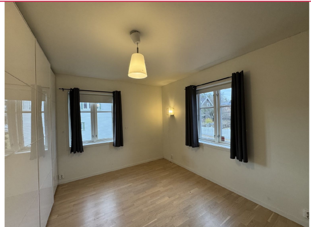
Hovedsoverom med integrert skyvedørgarderobe. Plass til dobbeltseng.