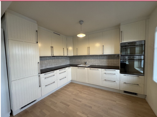
Lyst og pent kjøkken med kombiskap, oppvaskmaskin, komfyr, steketopp og mikrobølgeovn.