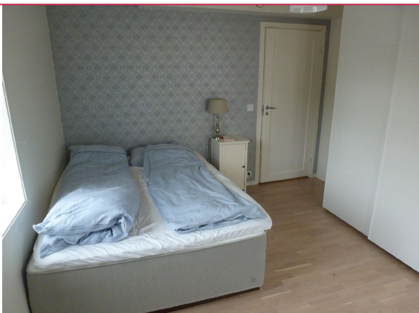
Hovedsoverom med integrert skyvedørgarderobe. Plass til dobbeltseng.