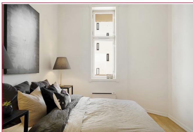
Soverom vendes mot bakgården.