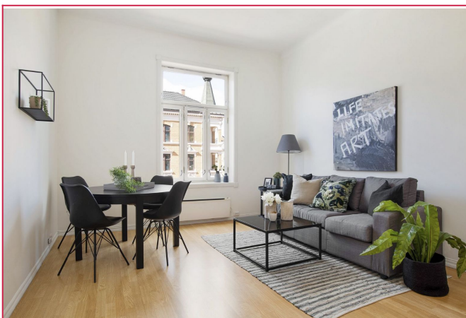
Stuen oppleves som lys og luftig.