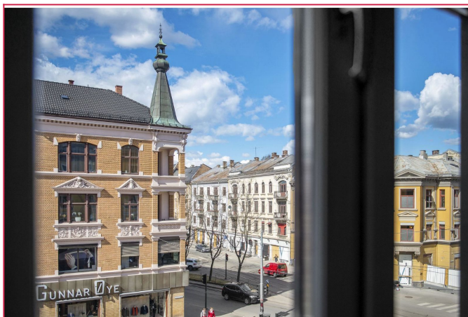
Fantastisk utsikt fra stuen mot Valkyrie plass.