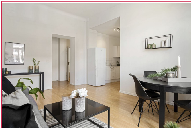
Velkommen til Bogstadveien 50