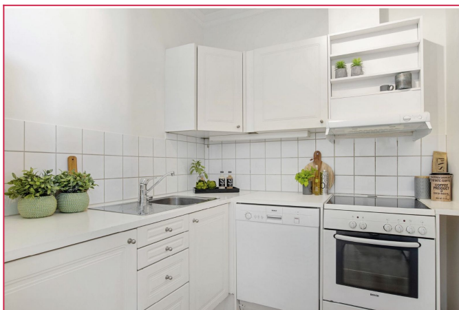
God benk- og lagringsplass.