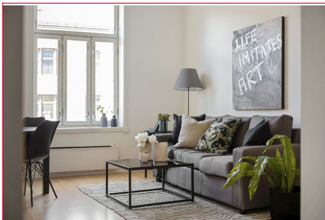
Stuen oppleves som luftig, lys og med god takhøyde.