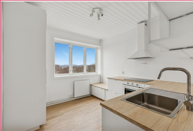
Stilrent og nytt kjøkken med integrerte hvitevarer