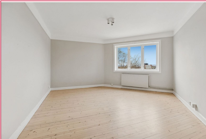
Romslig stue med plass til sofagruppe med tilhørende møblement