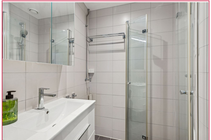
Flott bad fra 2020