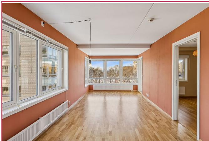
Dette er en romslig 2-roms hjørneleilighet med store vindusflater.

SAKSNUMMER 65966 - LILLOGATA 12, 0484 OSLO