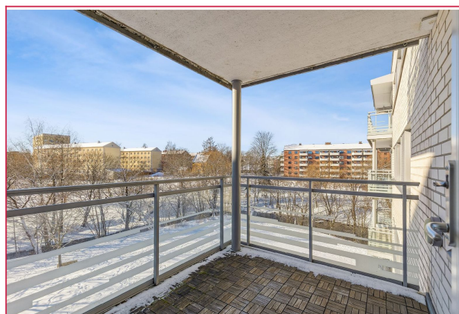
Stor balkong med ustikt utover akerselva.