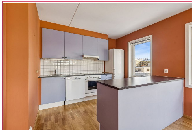
Kjøkkenet ligger i åpen løsning til stuen og er innredet med hvitevarer.