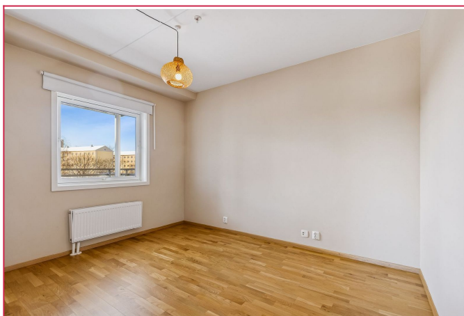
Romslig soverom malt i en behagelig farge.