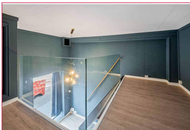
Velkommen til visning.