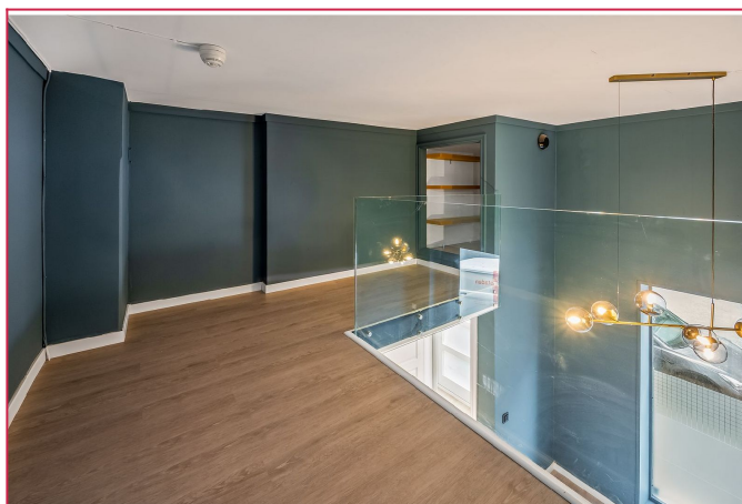
Hems med innvendig bod.