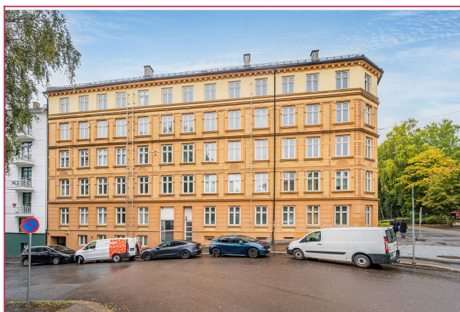
Velkommen til Christies gate 36E.