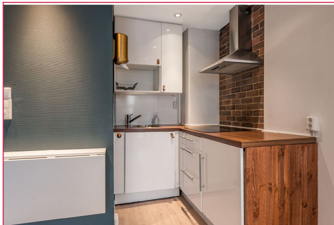
Kjøkken med koketopp og vaskemaskin.