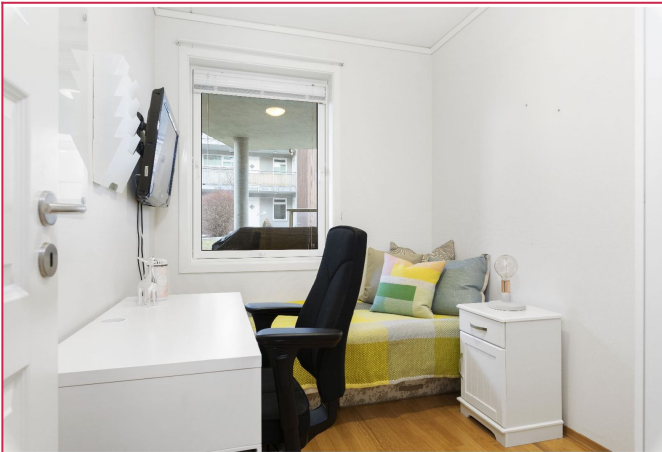
Soverom ( leies ut umøblert)