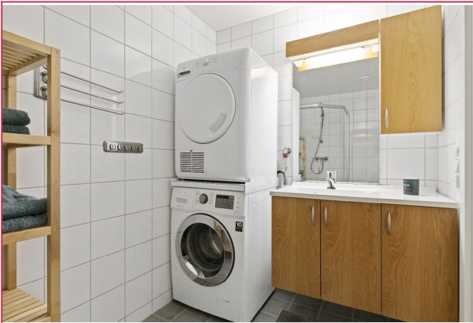
Bad ( vaskemaskin/tørketrommel medfølger ikke)