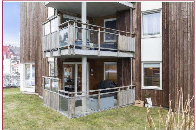
Terrasse ( grunnplan)