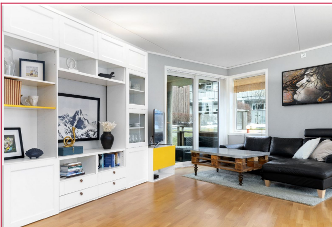
Stue mot terrasse