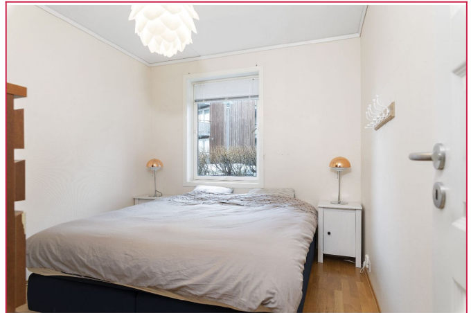
Soverom ( leies ut umøblert)