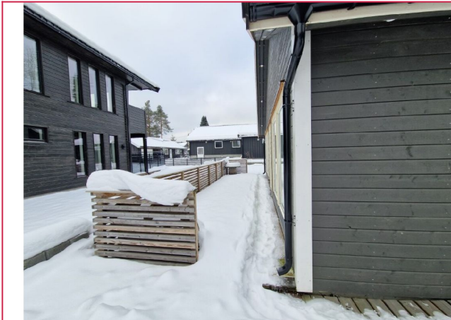
Terrasse med adkomst til hageflekk.