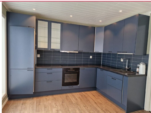
Kjøkkenet med rikelig av skap- og benkeplass. Integreerte hvitevarer.