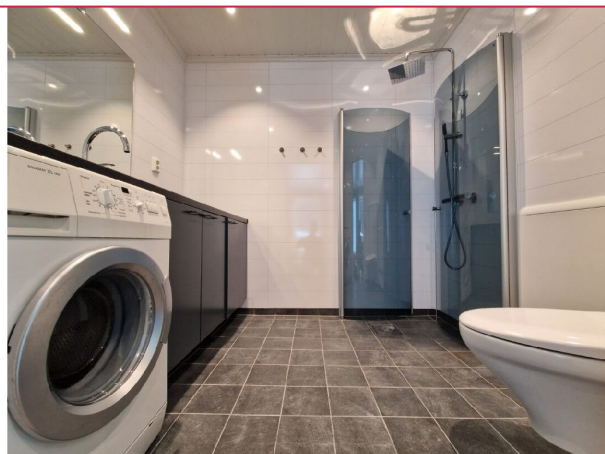
Flislagt bad med stor benkeplate og dusj. Vaskemaskin og vegghengt toalett.