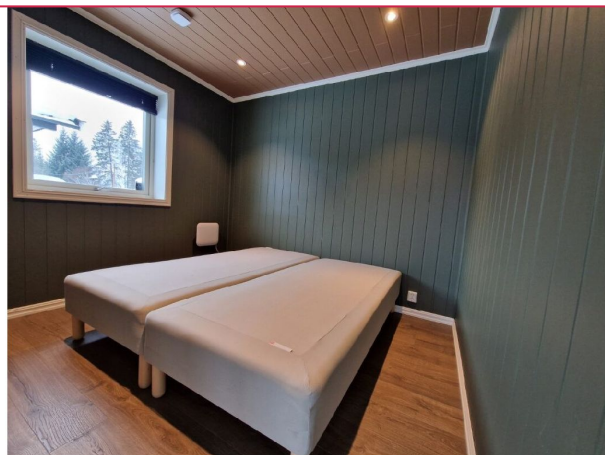
Soverom av romslig størrelse i moderne utførelse.