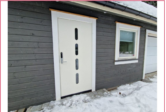
Nyere påbygg med steinlagt inngangsparti.