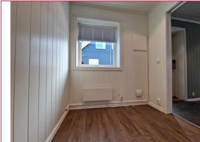
Rom ved entréen som fint kan brukes som hobbyrom.

SAKSNUMMER 66050 - P. CHR. ASBJØRNSSENS VEG 6 B, 2407 ELVERUM