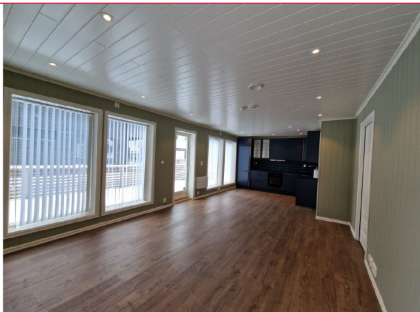
Romslig stue med store vinduer og spotter i taket.

SAKSNUMMER 66050 - P. CHR. ASBJØRNSSENS VEG 6 B, 2407 ELVERUM