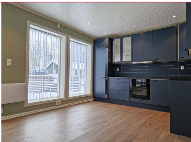
Ved kjøkkenet får man plass til kjøkkenbord.