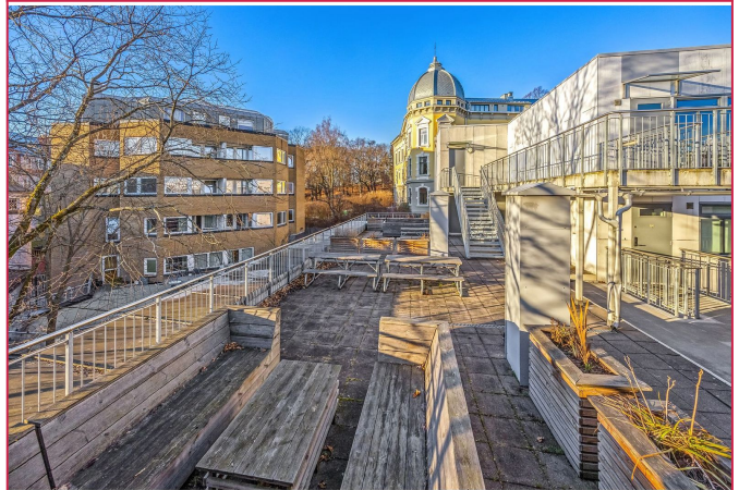
Felles solrik takterrasse som vender mot parken.