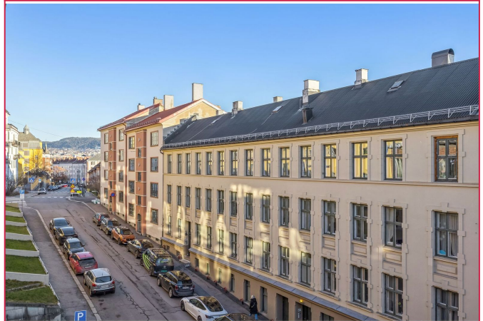
Meget hyggelig utsyn fra leiligheten. Boligen er beliggende på populære St. Hanshaugen.