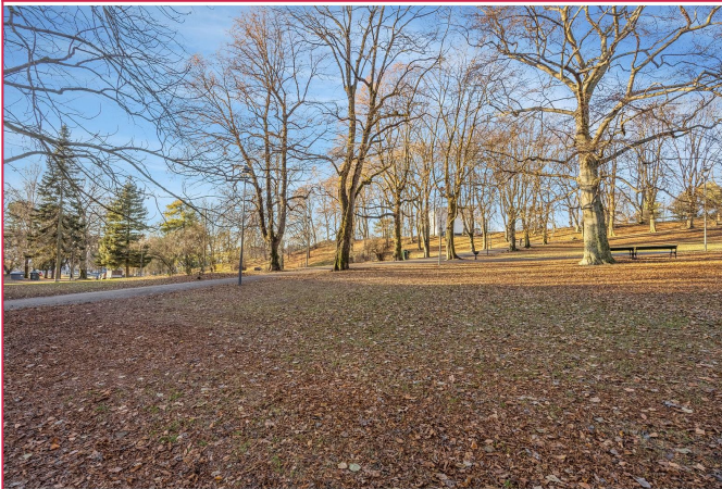
St. Hanshaugen park i umiddelbar nærhet.