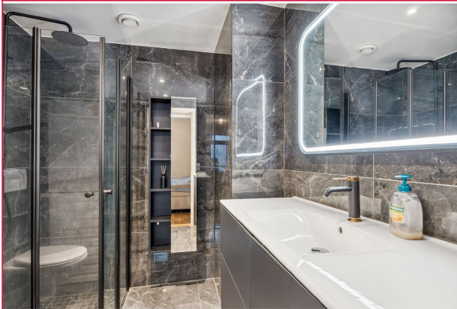
Badet ble renoveret i 2023 og er lekkert flislagt med gulvvarme.