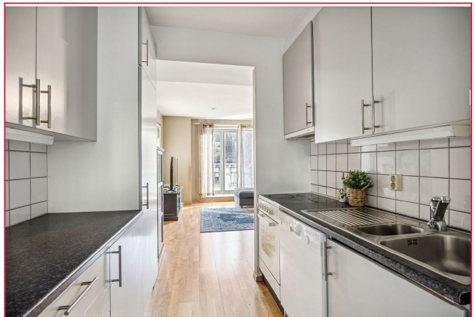
Kjøkken leies ut med hvitevarer.