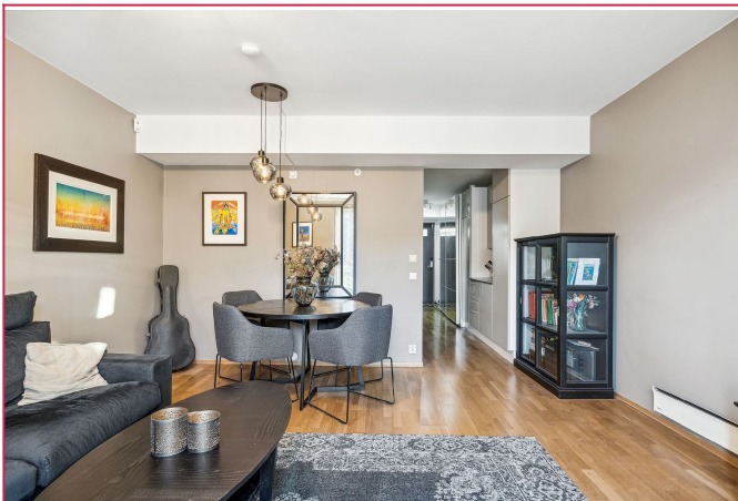
Leiligheten kan leies møblert/ umøblert etter avtale.