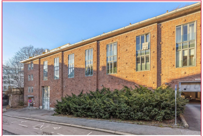
Fasade. Boligen ligger i byggets 3. etasje med heisadkomst.