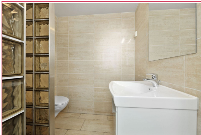
Pent flislagt bad med opplegg for vaskemaskin