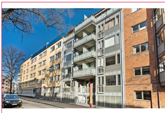
Fasade. Leiligheten vender ikke ut mot gate men inn mot atrium