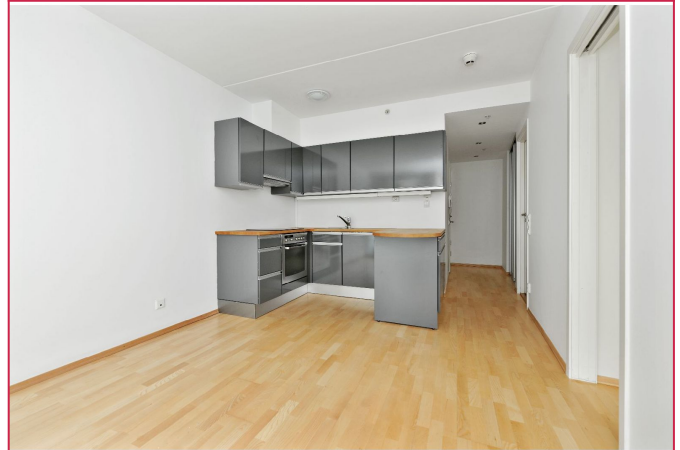
Stue mot kjøkken