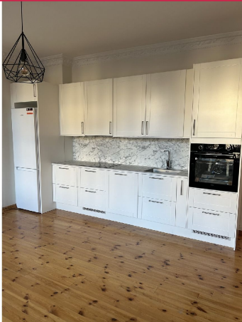
Moderne kjøkken med integrerte hvitevarer.