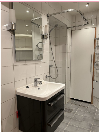
Bad med opplegg til vaskemaskin.