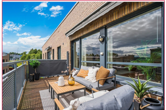
God plass til sittegruppe