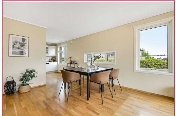
God plass til spisegruppe