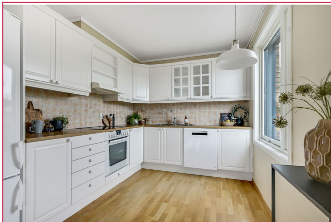
Hvitevarer følger med