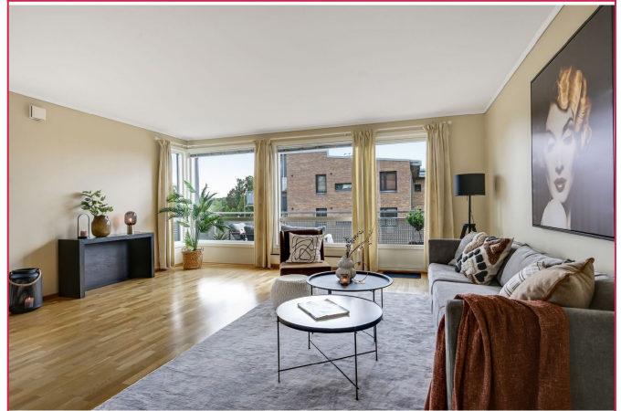
Ut fra stuen er balkongen