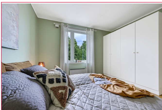
Soverom 1 - mye skaplass