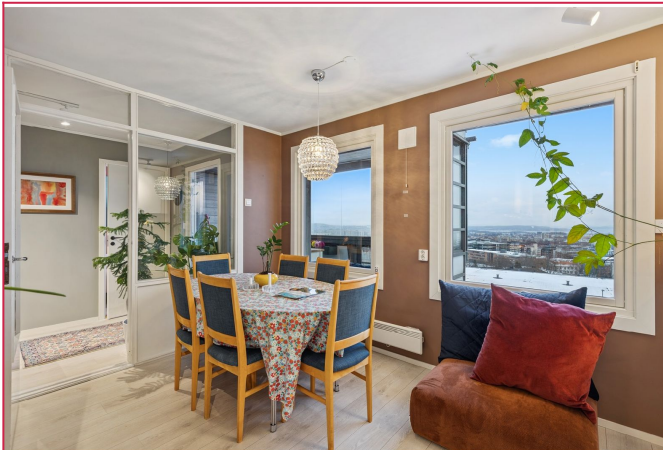
Leiligheten ligger høyt til med flott utsikt.