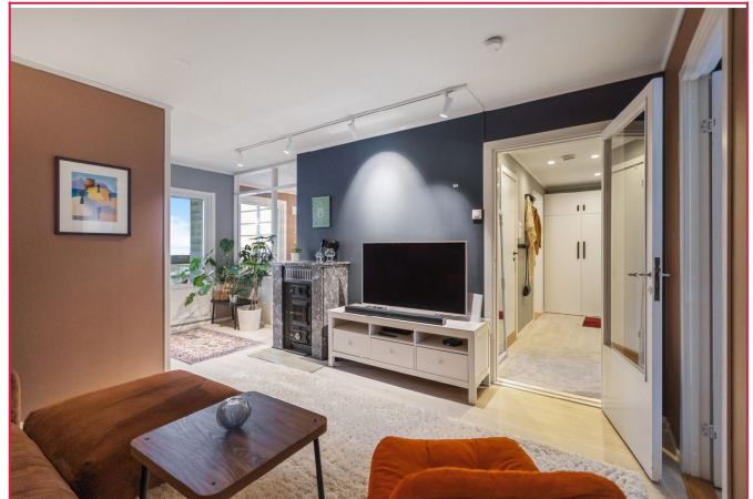
Leiligheten har god planløsning med tre gode soverom.