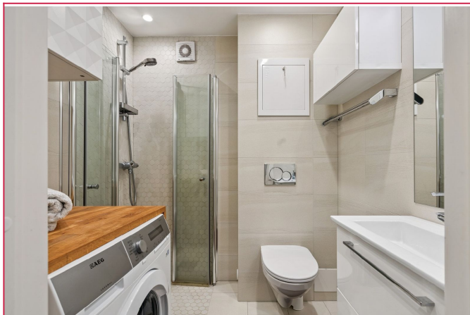
Pent flislagt bad.