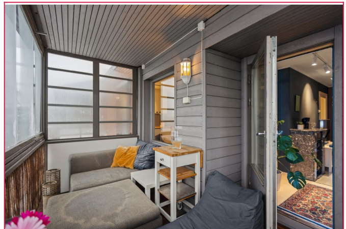
Utgang til innglasset balkong fra stuen.