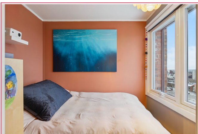
Soverom I med god utsikt.