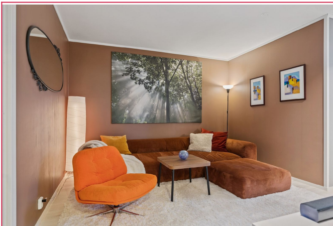
Leiligheten er møblert.