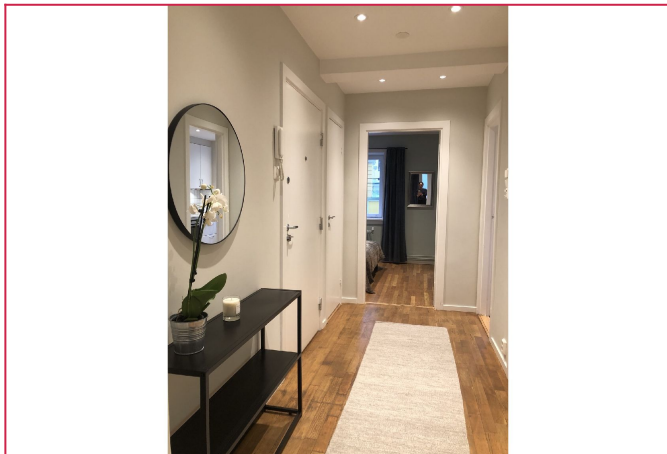
Entresomslig entre med bod for oppbevaring