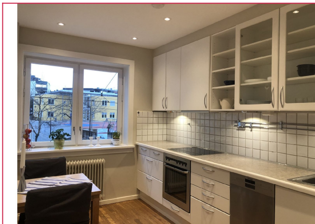
Koselig separat kjøkken med hvitevarer inkludert.