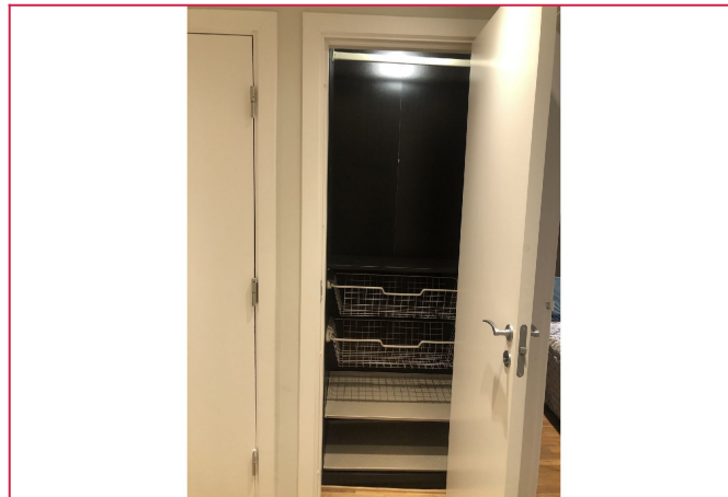
I entreen er det en praktisk garderobe for ytterklær samt en innvendig bod for ekstra lagringsplass