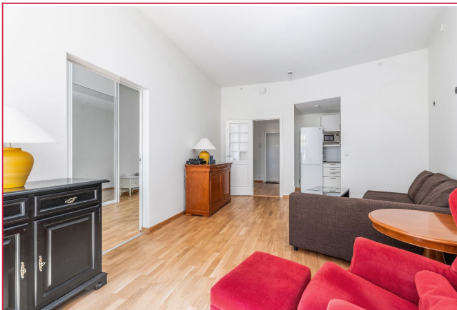
Stue med plass til sofamøblement og spise plass