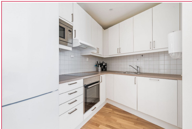
Kjøkken med alle hvitevarer integrert