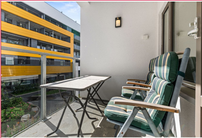
Balkong med utemøbler