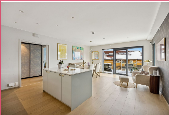
Nydelig åpen kjøkken- stue løsning