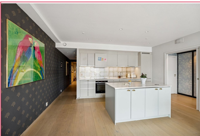
Kjøkken med sosialt kjøkkenøy