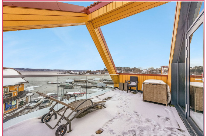
Balkong med fantastisk utsikt