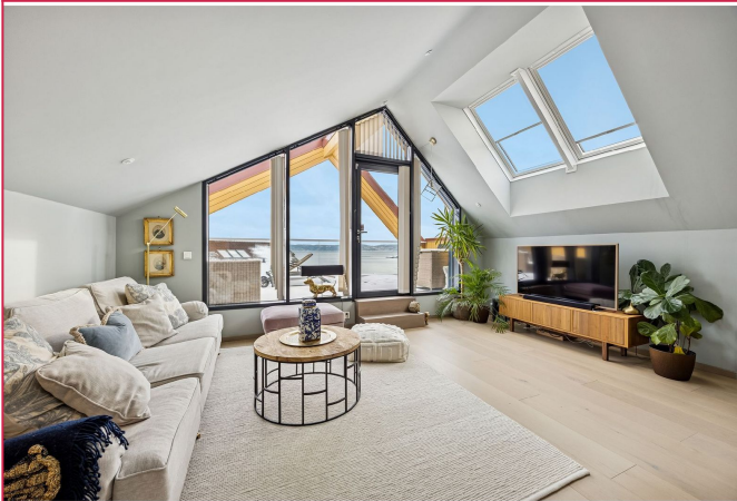
Stue nr. 2