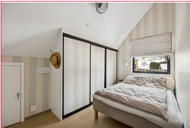
Soverom nr. 3/3