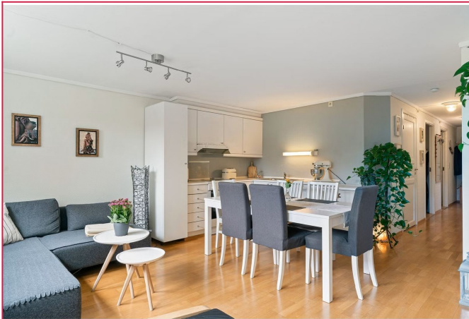
Romslig leilighet på Randaberg