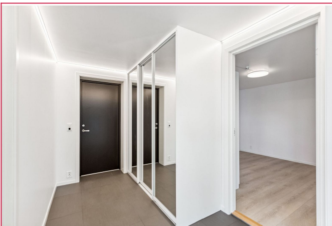
Romslig entre med praktisk skyvedørgarderobe med innredning for oppbevaring av yttertøy, sko m.m.