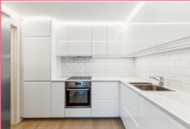
Pent kjøkken med integrerte hvitevarer og frittstående kjøleskap. Godt med skap- og benkeplass.