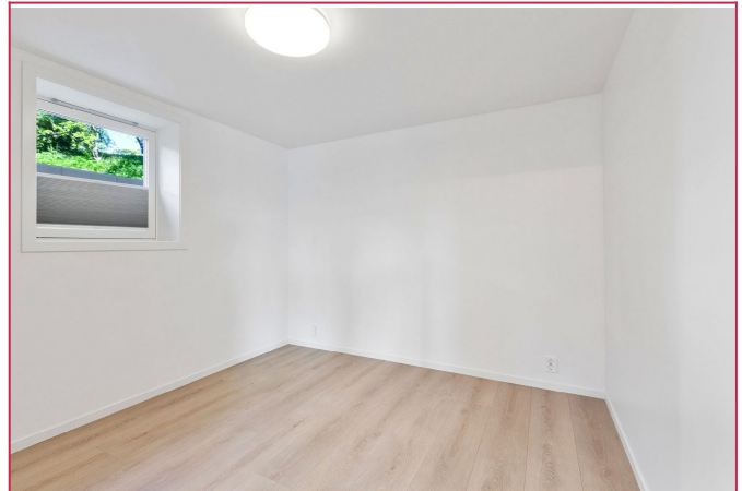
Hovedsoverom med god plass til dobbeltseng. Garderobeskap følger med.