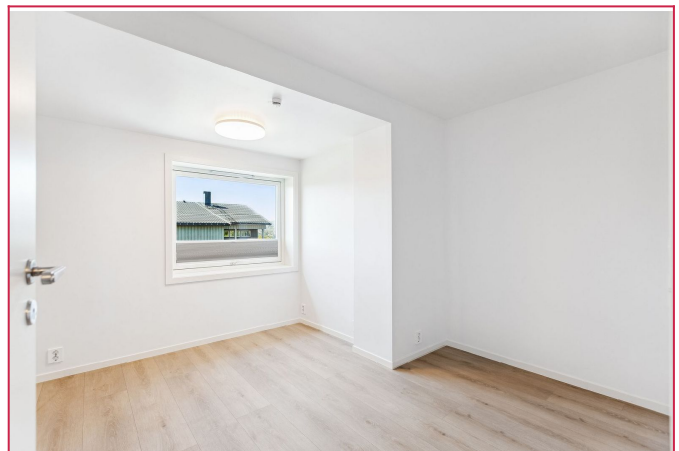
Begge soverom har god plass til seng, nattbord, skap og eventuelt skrivepult.