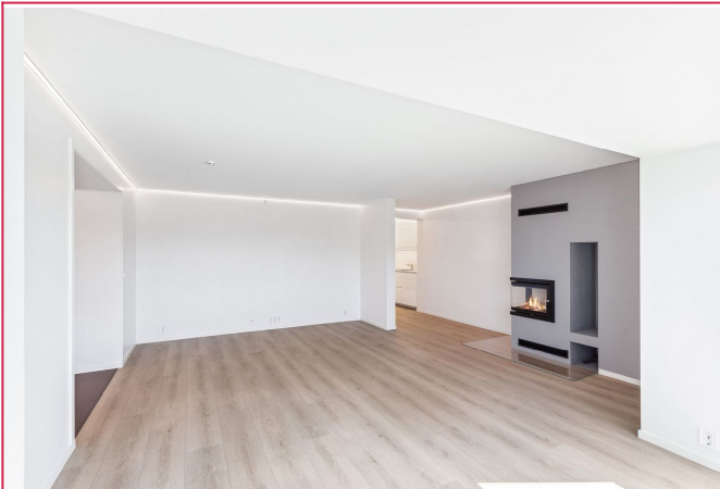
Stor stue med god plass til både spisegruppe og sofagruppe. Varme i gulv samt peis for vedfyring