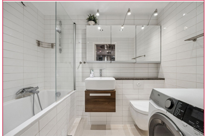
Delikat og romslig bad med masse oppbevaringsplass