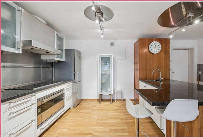
Pent kjøkken med barløsning og integrerte hvitevarer