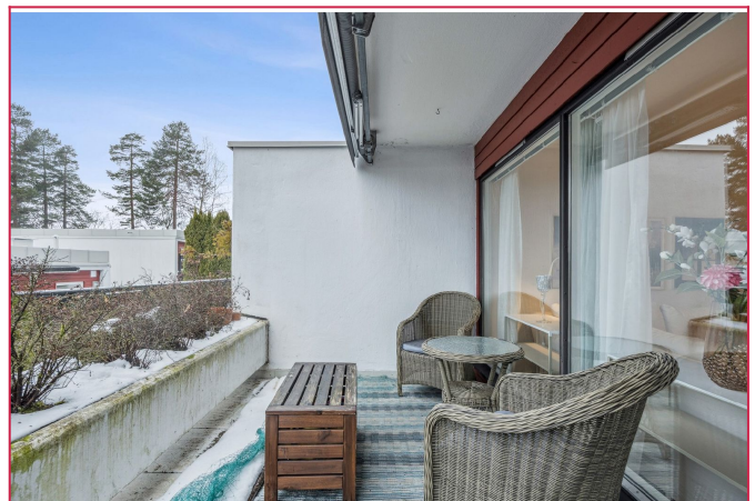
Luftig og romslig terrasse