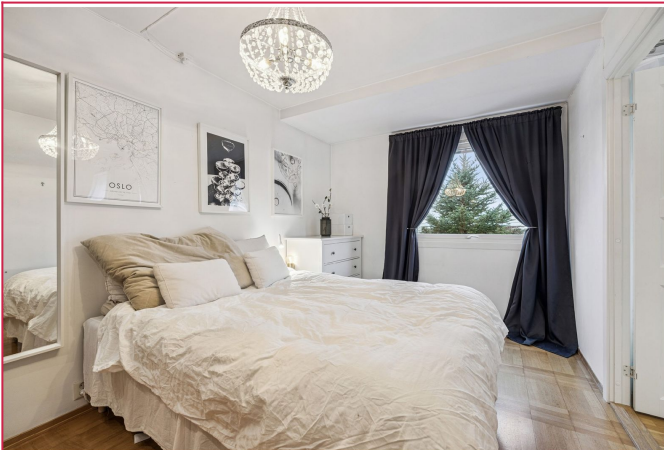
Flott og stort hovedsoverom