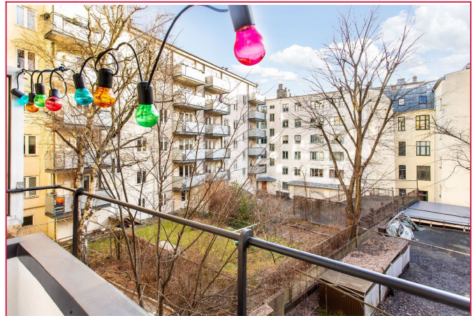
Balkong mot stille bakgård