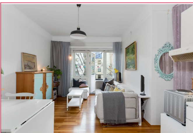
Håper å se deg på visning!