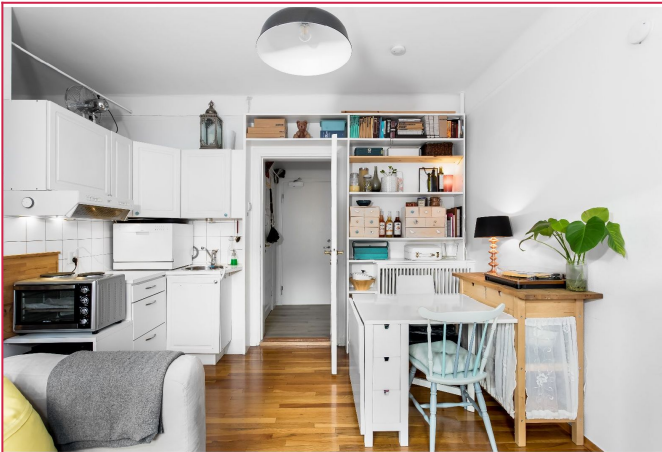
Kjøkkenet har godt med skaplass