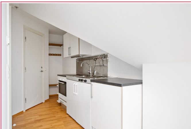
Innhuk ved entrè til sko- og yttertøy.