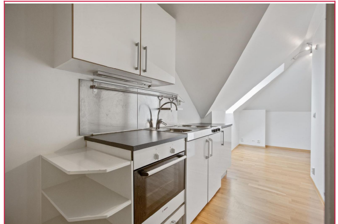
Kjøkkenet er praktisk plassert i forlengelse av gang.