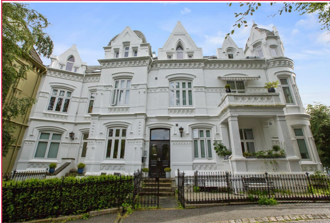
Praktisk og sentral hybel til leie! Flott fasade